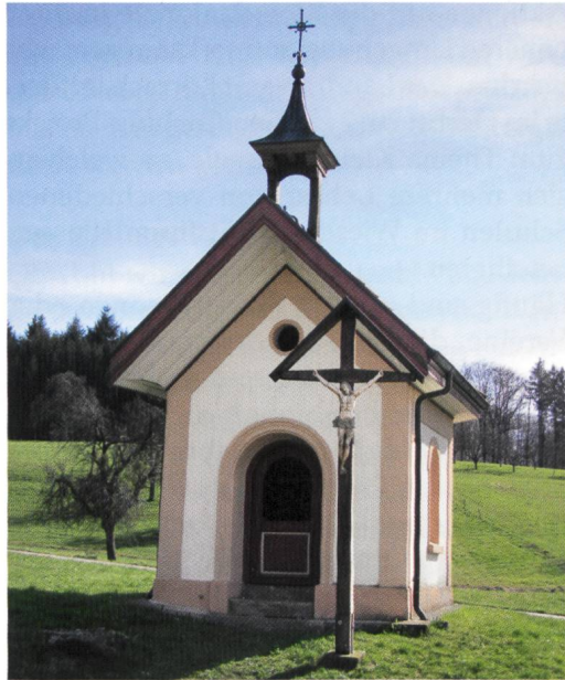
Kriegerdenkmal in Minseln von 1897.