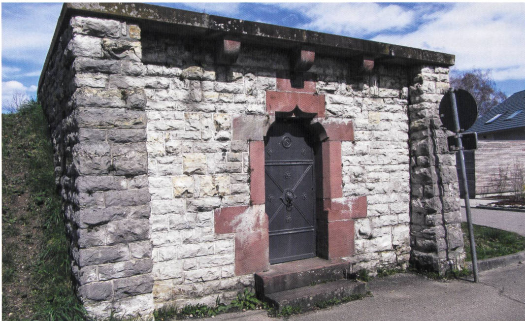
Wasserreservoir in Karsau aus dem Jahr 1907.