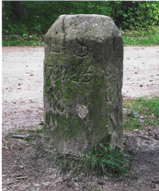
Tafel zum Siebenbannstein.