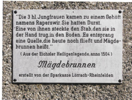
Mägdebrunnen an der Gemarkungsgrenze Adelhausen/Eichsel.