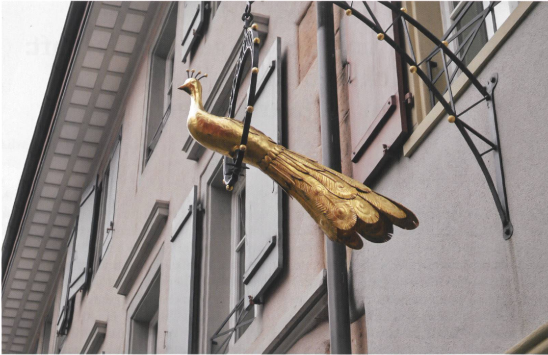
Abb. 2 In der Laufengasse von Laufenburg erinnert heute ein goldener Pfau an das einstige Gasthaus Pfauen, wo 1415 für zehn Tage Papst Johannes XXIII. logierte.

um so den Weg für die Wahl eines neuen Kirchenoberhauptes zu ebnen. Johannes, der als einziger Papst in Konstanz weilte, verweigerte den Rücktritt und ergriff die Flucht nach vorn oder besser gesagt aus Konstanz. Am 20. März 1415 verliess er mit Unterstützung des österreichischen Herzogs Friedrich IV. heimlich die Konzilsstadt und flüchtete nach Schaffhausen (Abb. 1). Am 29. März trafen Papst und Herzog in Laufenburg ein. Johannes nahm im Gasthaus Pfauen Quartier (Abb. 2). In alle Richtungen versandte er Schriftstücke, um sein Tun zu rechtfertigen und seine Anhänger zu mobilisieren. Zehn Tage später verliess Johannes als Krieger verkleidet Laufenburg und gelangte über Todtnau nach Freiburg, wo er im Namen des Königs verhaftet wurde. Die Auseinandersetzung um den Stuhl Petri endete erst am 11. November 1417, am Martinstag,