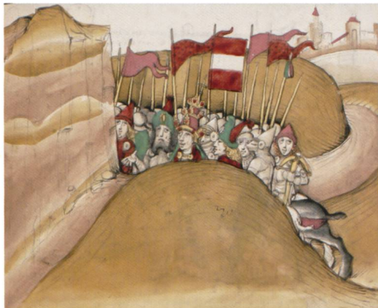
Abb. 1 Gegenpapst Johannes XXIII. flüchtet mit Herzog Friedrich IV. von Österreich aus Konstanz. (Aus der Spiezer Chronik von Diebold Schilling, 1484/85)

Ende Oktober 1414 hielt Papst Johannes XXIII. in Konstanz einen prächtigen Einzug. Das Konzil verlief jedoch nicht nach seinem Wunsch. König und Konzilsvertreter drängten alle drei Päpste zum Rücktritt,