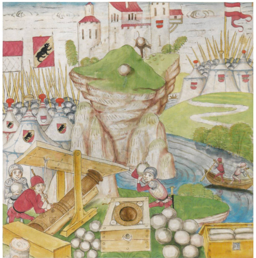
Abb. 8 Beschiessung der Inselburg Stein bei Rheinfeldens 1445. Auf dem gegenüberliegenden Ufer ist das Truppenlager von Herzog Albrecht VI. von Österreich erkennbar. (Aus der Amtlichen Berner Chronik von Diebold Schilling, 1478–1483)

Beute lockte nun auch in Rheinfeldens, wo die Basler mit ihren Verbündeten im Sommer 1445 den Stein belagerten und beschossen. Herzog Albrecht VI. konnte mit seinem Truppenaufmarsch am gegenüberliegenden Rheinufer die Kapitulation der Burgbesatzung nicht verhindern (Abb. 8).