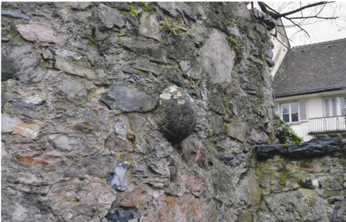
Abb. 5 Im Schalenturm beim Laufenburger Burgmattparkplatz eingemauerte, steinerne Kanonenkugel. Sie symbolisiert die Standhaftigkeit der Stadtbefestigung und stammt möglicherweise von der Belagerung durch die Eidgenossen 1443.

Nach einem kurzen Waffenstillstand flammte im Sommer 1444 der Krieg zwischen den Eidgenossen und dem mit Österreich verbündeten Zürich von Neuem