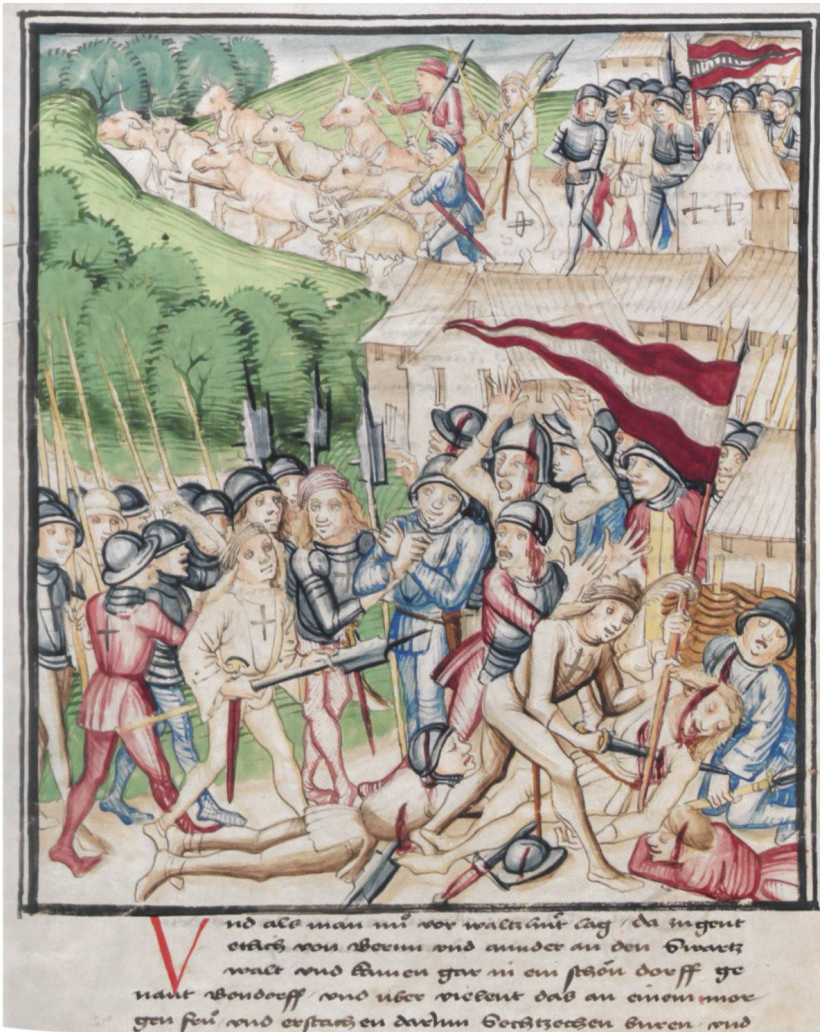
Abb. 10 Während der Belage- rung von Waldshut 1468 überfallen und plündern Eidgenossen Bonndorf. (Aus der Amtlichen Berner Chronik von Diebold Schilling, 1478–1483)