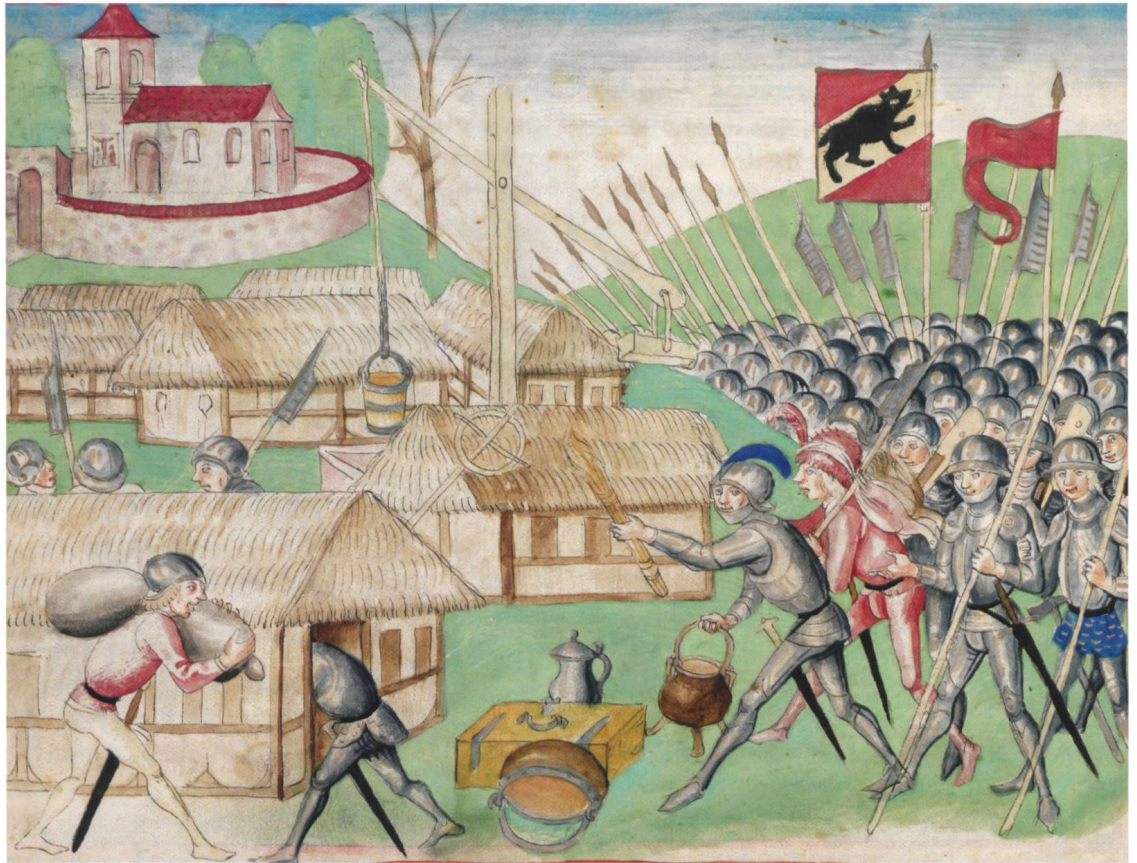
Abb. 13 Berner Kriegsknechte plündern ein Dorf. (Aus der Amtlichen Berner Chronik von Diebold Schilling, 1478–1483)

Dorf und steckten Häuser in Brand. Drei Personen, darunter der Dorfvoigt, wurden nach Säkingen verschleppt. Am selben Tag wurde Full von Waldshut aus angegriffen und zerstört. Wenig später überfiel ein grosses Kontingent, es sollen rund 1700 Mann gewesen sein, von Laufenburg und Waldshut aus das Kirchspiel Leuggern, unterstützt von Bauern aus dem Mettau- und Gansingertal. Wiederum wurden Dörfer geplündert und angezündet. Auch die im bernischen Amt Schenkenberg gelegenen Orte Hottwil, Mandach, Villigen und Remigen wurden angegriffen. Solothurn und Bern sann auf Rache. Man erwog einen Vergeltungszug ins Fricktal und zu den Waldstädten. Noch hielt sich