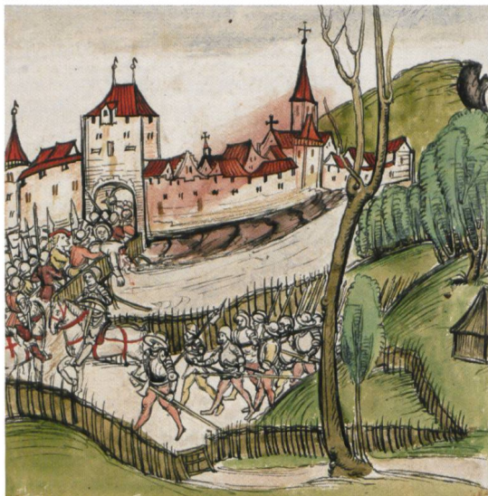
Abb. 6 Hans von Rechbergs Überfall auf Brugg 1444. (Aus der Bremgarter Schodoler Chronik, 1514–1532)

auf. Am 26. Juni begann ein etwa 20 000 Mann starkes eidgenössisches Heer mit der Belagerung der Limmatstadt, deren Verteidigung Rechberg organisierte und befehligte. Von Frankreich her nahte der bedrängten Stadt Hilfe. Der französische König Karl VII. liess ein vom Thronfolger angeführtes Söldnerheer, die Armagnaken, in Richtung Basel vorstossen.