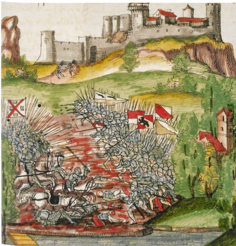
Abb. 12 In der Schlacht von Dornach 1499 besiegten die Eidgenossen die Truppen des Schwäbischen Bundes. (Aus der Chronik von Silbereisen, 1576)

Im Verlauf des Krieges kam es zu mehreren Schlachten und Gefechten der Eidgenossen und Bündner gegen den Schwäbischen