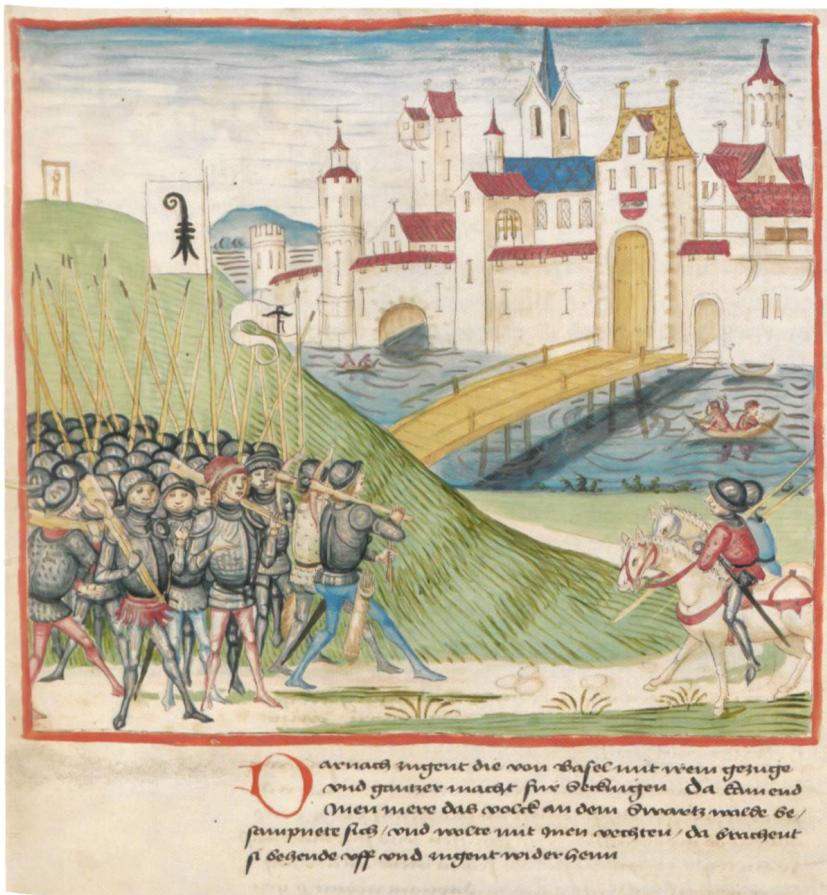
Abb. 3 Basler Truppen vor Säckingen 1415. (Aus der Amtlichen Berner Chronik von Diebold Schilling, 1478–1483)

In seiner Bedrängnis unterwarf sich Herzog Friedrich mit den leeren Taschen, wie er aufgrund seiner Verluste nun genannt wurde, am 7. Mai dem König. Dieser hob die Reichsacht auf und verlangte die Rückgabe der eroberten Gebiete an Friedrich. Doch die Eidgenossen dachten nicht da-