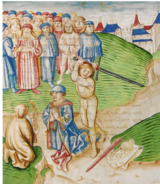
Abb. 11 Hinrichtung des burgundischen Landvogts Peter von Hagenbach in Breisach 1474. (Aus der Amtlichen Berner Chronik von Diebold Schilling, 1478–1483)

Ungelöste Rechts- und Grenzstreitigkeiten beidseits des Rheins führten am Ende des 15. Jahrhunderts zu Auseinandersetzungen zwischen den Eidgenossen und den «Schwaben». Ein solcher Streitpunkt war etwa das Thurgauer Landgericht, das sich im Besitz der Stadt Konstanz befand; bei einem anderen Konflikt ging es um Vog-