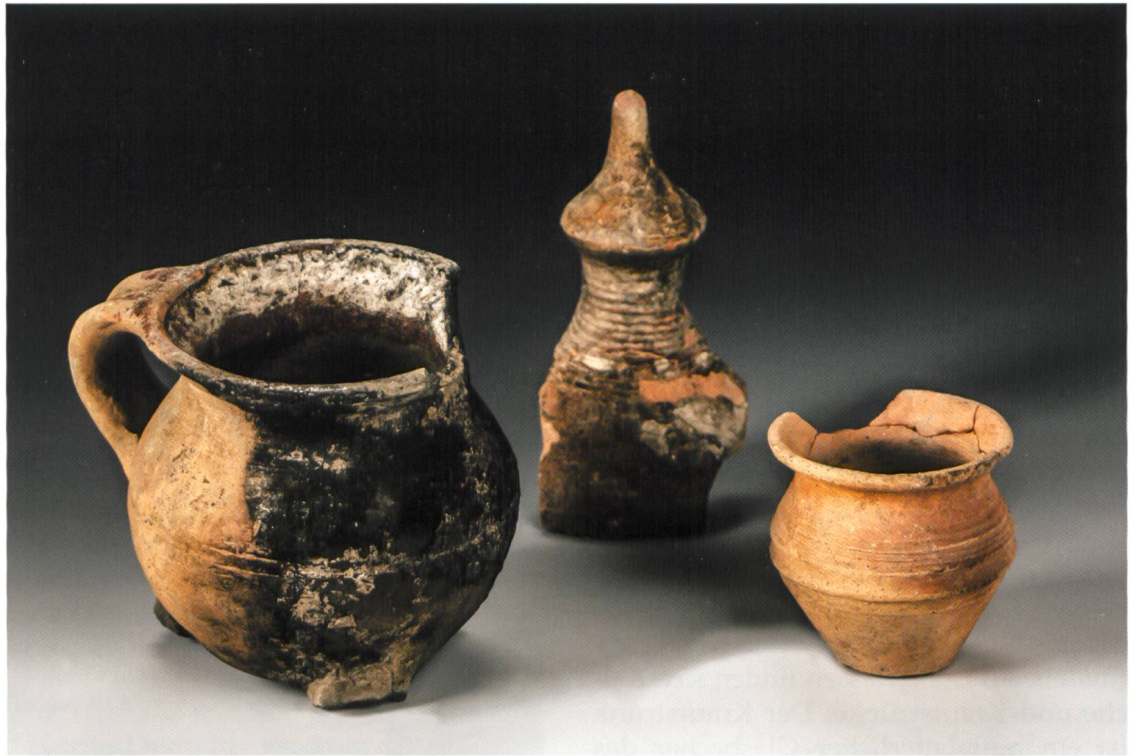
Abb. 8 Laborgefäße: (v. l.) Schmelzgefäß, Destillierhelm, Salbentöpfchen.