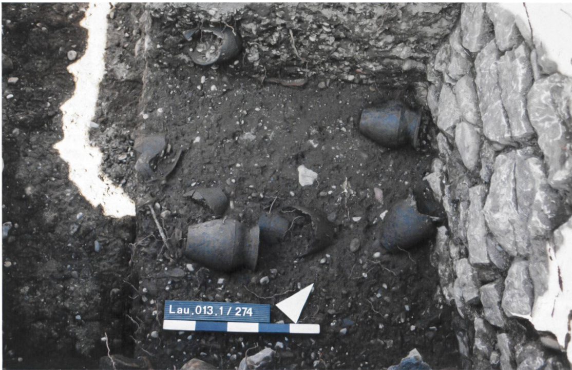
Abb. 2 Einige Töpfe konnten noch vollständig aus dem Keller geborgen werden. Töpfe in Fundlage.

Mauern belegen, dass das Siechenhaus ein Fachwerkgebäude war.