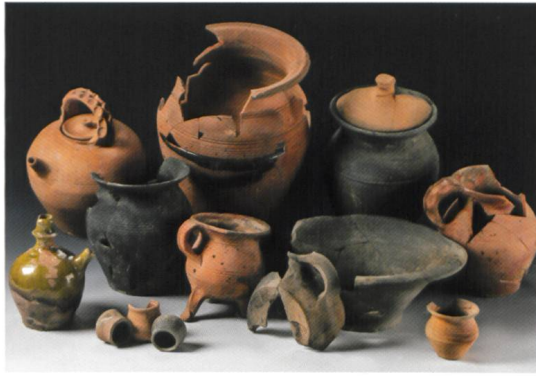
Abb. 3 Keramikinventar aus dem Keller des Siechenhauses (siehe dazu den Beitrag von P. Frey in diesem Heft).