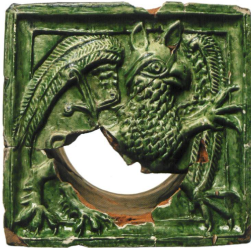
Abb. 5 a/b a) Ofenkachel mit Greif aus der Ausgrabung Laufenburg-Siechenbifang 2013. b) Eine formgleiche Ofenkachel wurde in Frick an der Hauptstrasse 72 in einer Zerstörungsschicht gefunden. Sie weist starke Spuren eines Hausbrandes auf.