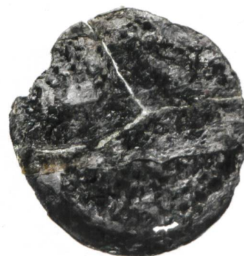
Abb. 10 a/b Münze.