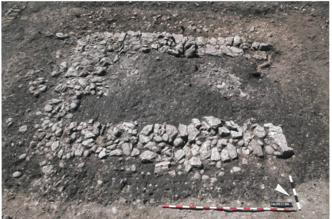
Abb. 1 Die Kellermauern vor dem Ausheben der Verfüllung.

Der Keller war nur auf drei Seiten mit Mauern begrenzt, auf der Westseite fehlte sie (Abb. 1). Hier muss der Eingang des Kellers gewesen sein. Vermutlich war dies eine Holzrampe oder eine Treppe. Der Innenraum des Kellers hatte eine Länge von 3,8 m und eine Breite von 1,85 m. Reste von Fachwerklehm auf den zweischaligen