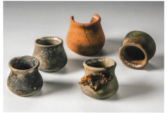
Abb. 4 Schröpfköpfe aus dem Kellerinventar.