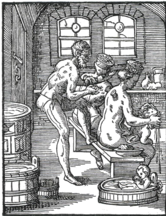
Abb. 9 Bader beim Schröpfen. Stich von Jost Amman 1568.

wurde sogar als vorbeugende Massnahme eingesetzt (Abb. 9). 6 Das Schröpfen, das Aderlassen und das Haarschneiden waren Aufgaben des Baders. 7 Vermutlich hat der Bader von Laufenburg diese Arbeiten im Siechenhaus durchgeführt.