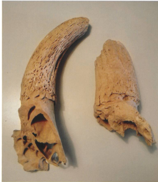
Abb. 5 Knochen von Kaninchen.