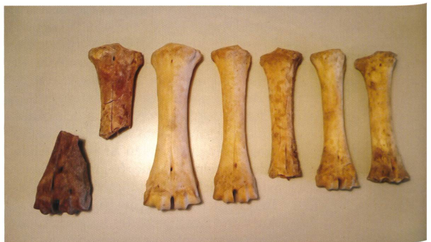
Abb. 1 Auswahl an Rindermetapodien.

Das erstaunliche an den Schädelfragmenten ist, dass es sich um vier linke Schädelhälften von vier verschiedenen ausge-