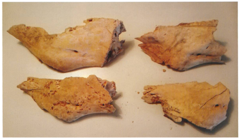
Abb. 3 Schädelfragmente von Rindern.

wachsenen Rindern handelt. Die Teile des Oberkiefers sowie des Vorderschädels sind in ähnlich grosse Stücke zerlegt. Obwohl die Fragmente einander nicht zugeordnet werden konnten, ist davon auszugehen, dass je ein Oberkieferfragment und ein Stirnfragment zusammengehören und es sich um vier Individuen gehandelt hat (Abb. 2 und 3).