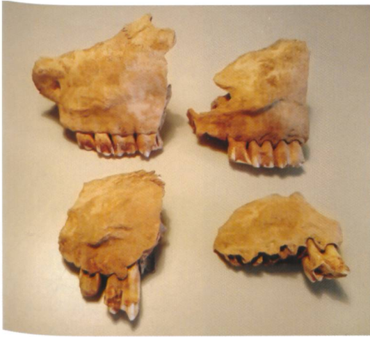
Abb. 2 Oberkieferfragmente mit Zähnen von Rindern.