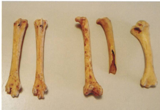
Abb. 7 Oberschenkelknochen einer ausgewachsenen Gans.