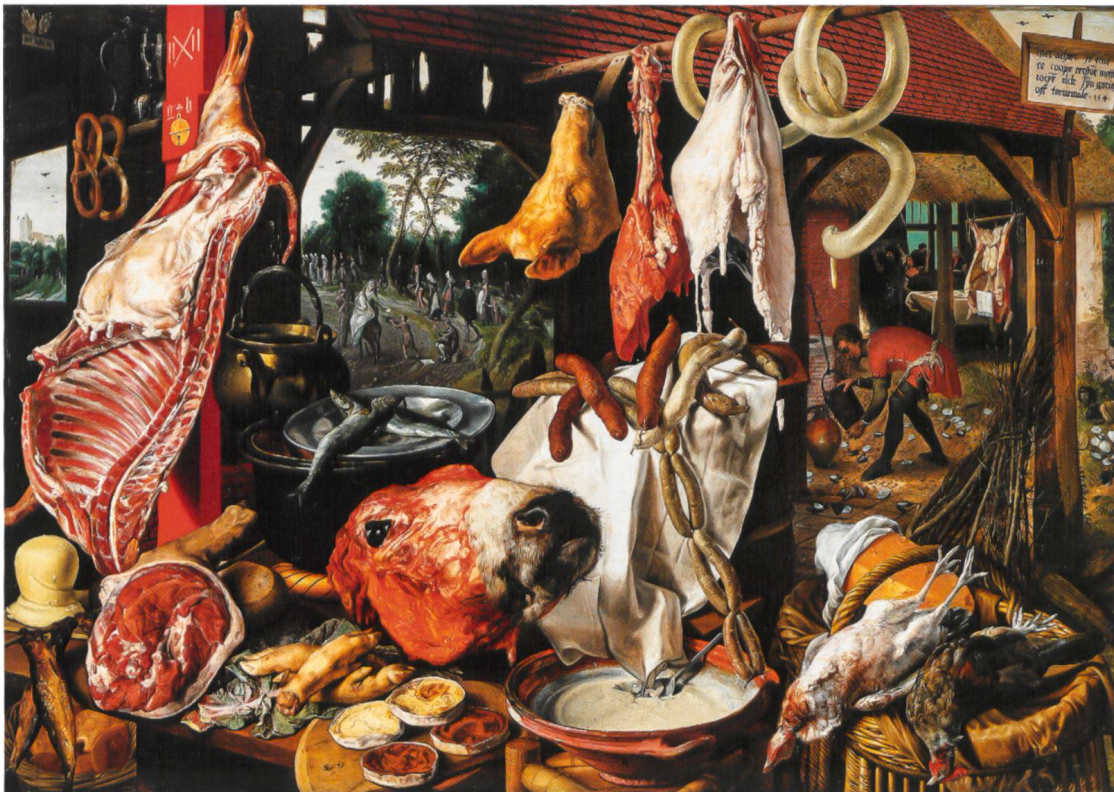
Abb. 8 Marktstand eines Metzgers. «Metzgerverkaufsstand mit der Heiligen Familie auf der Flucht nach Ägypten, Almosen verteilend», Gemälde von P. Aertsen, 1551

Grössere Mengen an Fleisch – vor allem Rindfleisch – wurden aber vermutlich zugekauft.