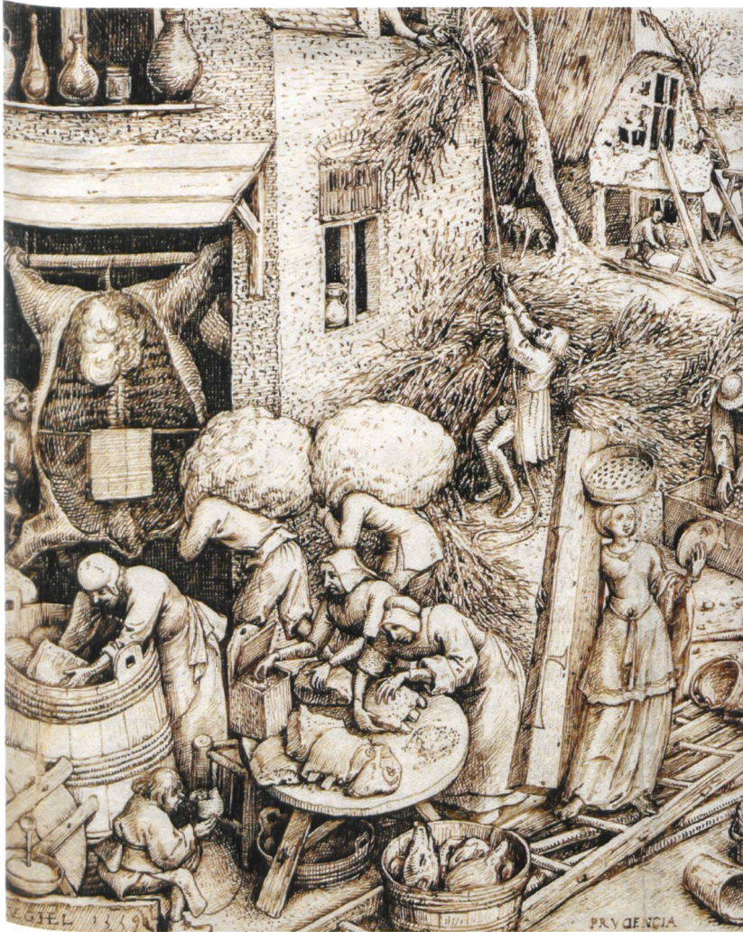
Abb. 9 Einsalzen von verschiedensten Fleischstücken. «Prudentia», Stich von Ph. Galle nach P. Brueghel d. Ä., um 1559.

geschmortes Kaninchenfleisch sowie die Verarbeitung zu Pastete. Leider sind an den vorliegenden Kaninchenknochen aus Frick keine Spuren sichtbar, die auf eine bestimmte Zubereitungsart hindeuten würden. Das Gleiche gilt für die Geflügelknochen von Huhn und Gans – verschiedene Rezeptsammlungen überliefern auch hier eine Fülle von Variationen der Zubereitung: auf unterschiedlichste Arten gebraten, geschmort oder als Füllung für Pasteten verarbeitet (vgl. Depper 2008).