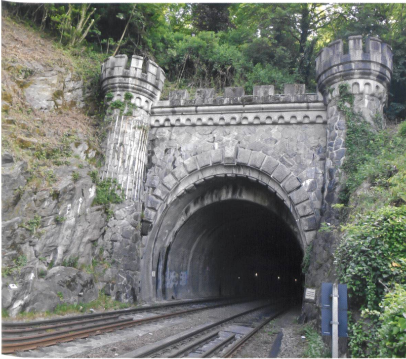
Beim Bau der Rheintal- linie durch die Badische Staats-Eisen- bahn entstand bei Laufenburg D 1856 der 372 m lange Rappen- steintunnel.

den 1840er Jahren voller Euphorie über die Vernetzung ihres Landes mit der ganzen Welt philosophierten 51 , begegnete die damals streng konservative Stadt Basel dem Eisenbahnbau ohne jede Begeisterung, ja mit grossem Misstrauen 52 . Dazu kam, dass die Stadt Basel sich wegen ihrer wirtschaftsgeographisch wichtigen Lage am Rheinknie in einer Position der Stärke wähnte und immer mehr Forderungen stellte. Für die Basler hatte der Schienenweg nach Süden, der durch den Hauenstein führte, Priorität. Diese Route war schon mit der Kutsche der übliche Weg von Basel nach Italien gewesen 53 . Aber das grossherzogliche Baden wollte ja nicht nur nach Basel, sondern weiter, dem Hochrhein entlang, Richtung Bodensee. Die mangelnde Kooperation der Basler liess die badischen Nachbarn bald in Erwägung ziehen, die Stadt Basel zu umgehen. 54 Mit der Idee