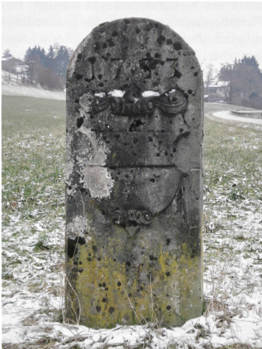
Heute keine Staatsgrenze mehr: Der Grenzstein an der Bözbergstrasse zwischen Hornussen und Bözen markierte einst die Grenze zwischen dem habsburgischen Fricktal und dem eidgenössischen Kanton Bern.

diese Vermutung. Pfarrer Lutzs Wunsch, im Fricktal möge die Liebe zum republikanischen System aufkommen und die Anhänglichkeit an Tells Nachkommenschaft feuriger werden, hätte sich somit erfüllt. Das Verhältnis des Fricktals zur Schweiz hatte sich am Ende des Jahrhunderts gefestigt. Dieses Ergebnis ist vor allem dem Bau der Eisenbahnlinien zu verdanken, die endlich den Anschluss an den schweizerischen Wirtschaftsraum brachten und den entsprechenden Verlust im Grenzraum wettmachten. Die Eisenbahn ermöglichte nicht nur den wirtschaftlichen Aufschwung im neuen schweizerischen Bundesstaat, sie verringerte auch die zeitliche Distanz zu den eidgenössischen Landsleuten. Das Schicksal des Fricktals im neuen Vaterland Schweiz hatte sich während des 19. Jahrhunderts also durchaus im Sinne von Markus Lutz entwickelt.