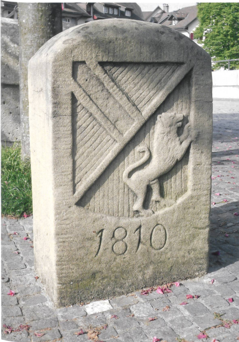
Grenzstein mit dem Wappen des Grossherzogtums Baden auf der Laufener Brücke. (Kopie, Original im Museum Schiff in Laufenburg CH).