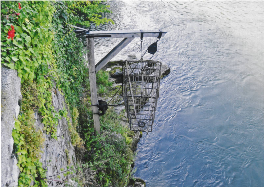
Eine Fischreuse neben der Laufenburger Brücke verweist auf das einst für die Stadt bedeutende Fischereigewerbe.

sich die Komplikationen. Am 7. Juli 1835 platzte dann die Bombe: Der badische Zöllner verkündete, dass das Grossherzogtum Baden dem Deutschen Zollverein beigetreten sei. 32