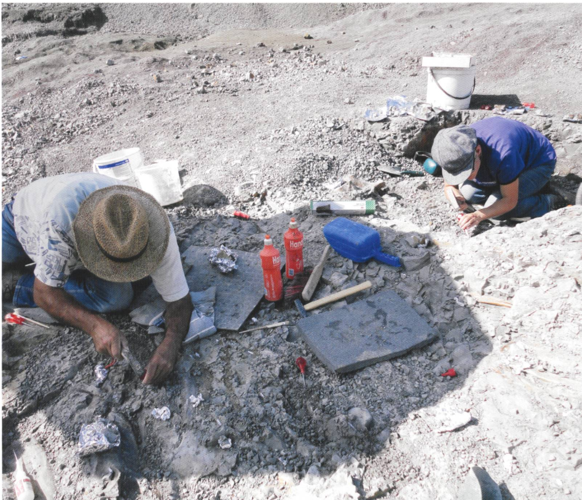
Abb. 4 Typische Grabungssituation: Jeder Knochen wird von Hand mit Hammer und Ahle freigelegt.