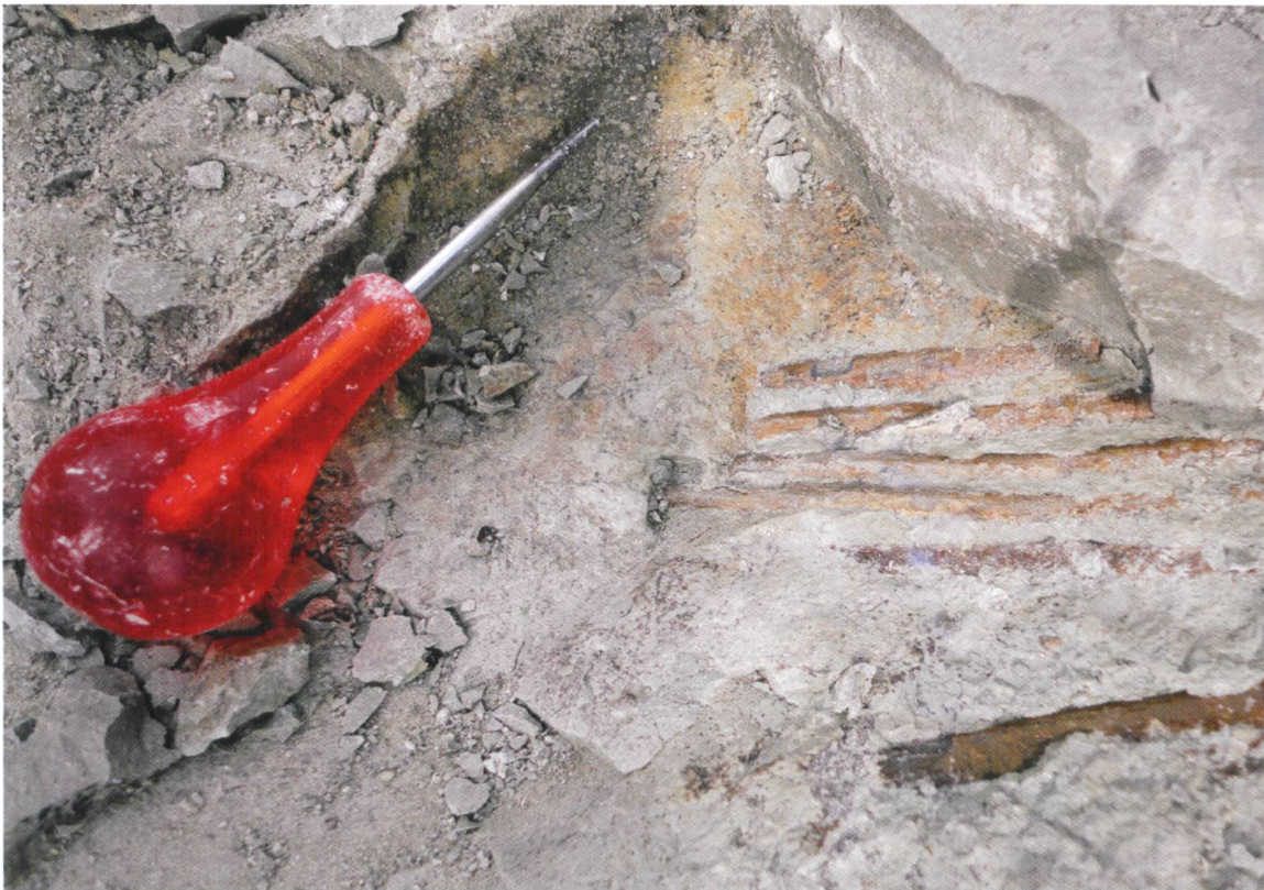
Abb. 2 Eine Handvoll parallel liegender goldener Bauchrippen war das Erste, was vom 8 m grossen Plateosaurier zum Vorschein kam.

Eine weitere Grabungsstelle in der «mittleren» Schicht im Süden der Grube, die erst nach den Sommerferien eröffnet worden war, entpuppte sich als wahre Wundertüte. Erst kamen ein paar einzelne Knochen zum Vorschein, dann ein artikulierter Fuss, bald darauf noch ein Fuss – bis realisiert wurde, dass es sich dabei um zwei rechte Füße handelte! Da mussten also mindestens zwei Tiere in dieser Rinne liegen.