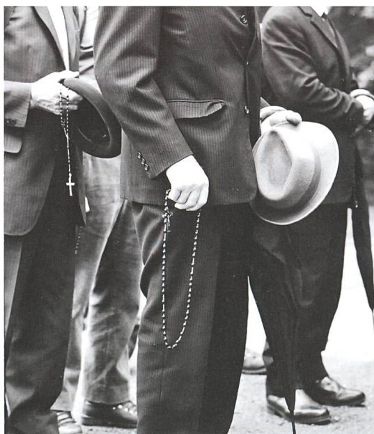
Abb. 6 Ausrüstung und Bekleidung der älteren Männer 1962. Blankgeputzte Schuhe, meist schwarze oder mindestens dunkle Kleidung mit Krawatte und Hut, Regenschirm und Rosenkranz – mehr brauchte es nicht.

Auf den bis nach dem Ersten Weltkrieg ungeteerten Strassen (Nebenstrassen bis in die 1960er-Jahre) und Wegen brauchte es robustes Schuhwerk und Kleidung. Meist wurde ein Rucksack oder eine Tasche mit dem Nötigsten mitgetragen. Mit der Asphaltierung der Hauptstrassen wurden die Sonntagsschuhe angezogen! Aufgrund der Möglichkeit, unterwegs in einem Gasthaus das Mittagessen einzunehmen, sah die Aus-