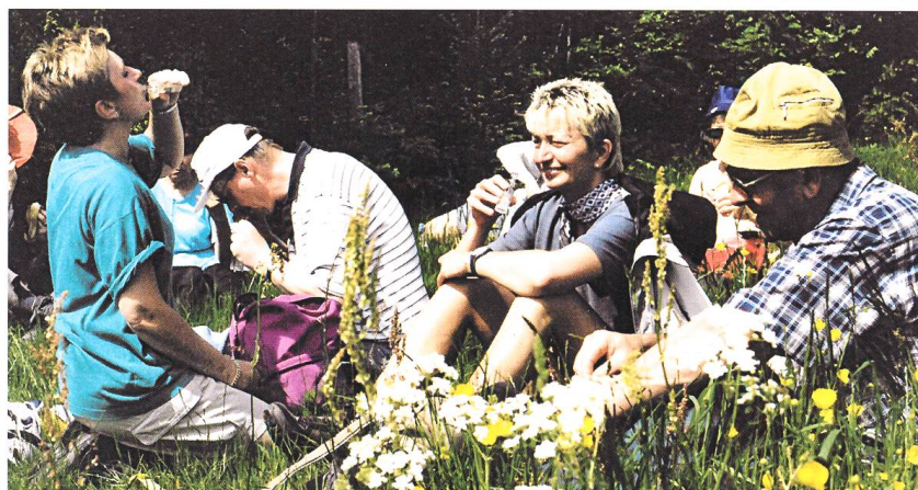
Abb.4 Marschhalt nach dem steilen Katzenstieg 2001. Dieser Halt findet am Waldrand etwa 10 Minuten vor der Kapelle Hogschür statt und wird Schnapshalt genannt, weil etliche Männer die Gelegenheit nutzen, einen Schluck aus dem Flachmann zu nehmen. Viele Frauen haben Zuckerwürfel dabei und stärken sich mit einem «Canärl» (Zuckerwürfel, über den Schnaps geträufelt wird).

hat sich die Pause nach dem Freimarsch hinauf zur Wehrhalde dort oben angeboten. Alle anderen Marschhalte finden seit Menschengedenken an den gleichen Orten statt. Wo die Wallfahrer in alter Zeit Mittagspause hielten, ist aus den Aufzeichnungen nicht ersichtlich. Vermutlich rastete man schon damals auf der Höhe von Hogschür, wo der Pilgerzug um die Mittagszeit ankommt. Bis 1953 bestand die Möglichkeit, ein einfaches Mahl im dortigen Gasthaus Drei Könige einzunehmen. Im folgenden Jahr war die Wirtschaft geschlossen und der Mittagshalt wurde eine knappe Wegstunde weiter beim und im Gasthaus zum Gugelturm in Giersbach gemacht (Abb. 5). Wenige Jahre später, mit der Zunahme der Anzahl Pilger, kam der Gasthof Waldheim in Kleinherrischwand dazu.