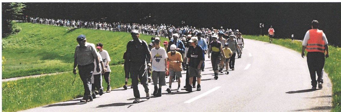
Abb.7 Verkehrsgruppe im Einsatz auf der L151 Richtung Hottingen anlässlich der Wallfahrt von 2001.

rüstung der meisten Männer so aus: Neben den Sonntagsschuhen trugen sie eine meist schwarze Kleidung (zumindest die älteren Herren) mit Krawatte, dazu selbstverständlich einen Hut. Neben dem Rosenkranz gehörte ein Regenschirm, der auch als Gehstock benutzt werden konnte, zur Ausrüstung (Abb. 6). Reservekleider wie Unterwäsche usw. trugen sie nicht mit. Bestenfalls Reservestrümpfe, die, wie der Schreibende das bei seinem Grossvater sah, mit einer Wäscheklammer an der Innentasche des Jacketts befestigt waren. Auch die Frauen und Mädchen waren der Zeit entsprechend gekleidet und ausgerüstet. Ausnahmslos alle trugen Röcke, wenige einen kleinen Rucksack. Hingegen schleppten viele eine relativ grosse Handtasche mit. All das ist eindrücklich im Film von der Wallfahrt 1962, gedreht von Oskar Keller, zu sehen.