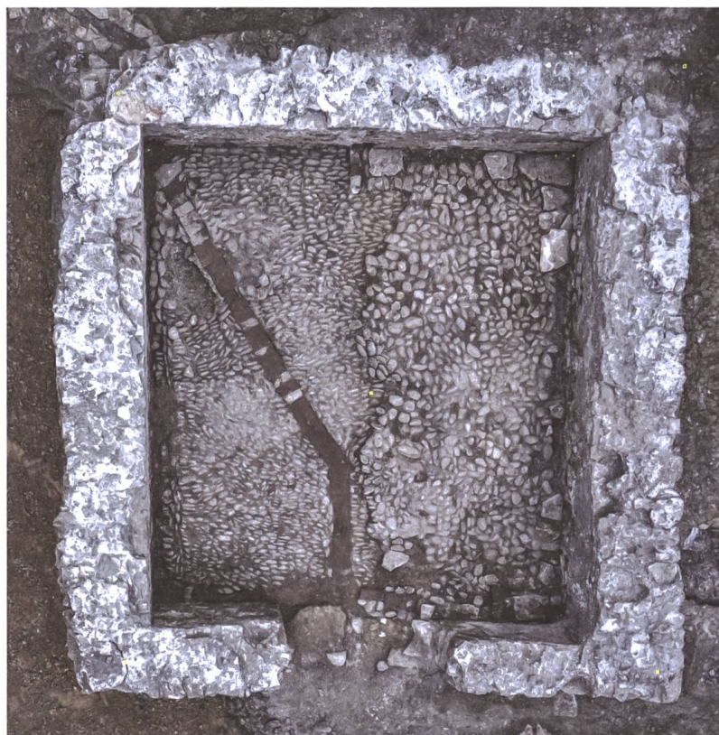
Abb. 11 Kaisten, Dorfstrasse 6, Parzelle 193. Grundriss eines neuzeitlichen Kellerbaus, Drainagen und Kiesel- pflästerungen.

Gleichzeitig zu den Ausgrabungen in Wallbach wurde in Mumpf die Kantonsstrasse erneuert. Im Bereich des Gasthofs Anker zeigten sich in den Leitungsgräben auf einer Länge von 300 m an mehreren Stellen eine Brandschicht, die eine Vielzahl von spätantiken Münzen enthielt | Abb. 10 |. Die neuen Erkenntnisse werden in die laufenden Auswertungsarbeiten zur spätrömischen Grenzbefestigung am Hochrhein einfließen.