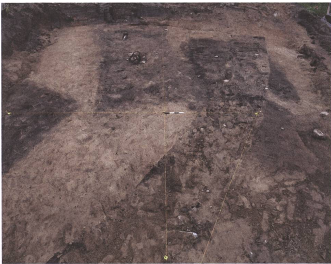
Abb. 6 Wallbach, Rheinstrasse, Parzelle 251. Die mittelalterlichen Grubenhäuser zeichnen sich im anstehenden Rheinsand als dunkelbraune Rechtecke von 3x4 m ab.

Abb. 8 Wallbach, Rheinstrasse 37. Renaissancezeitliche Ofenkachel aus dem brand- zerstörten Keller mit allegorischer Darstellung.