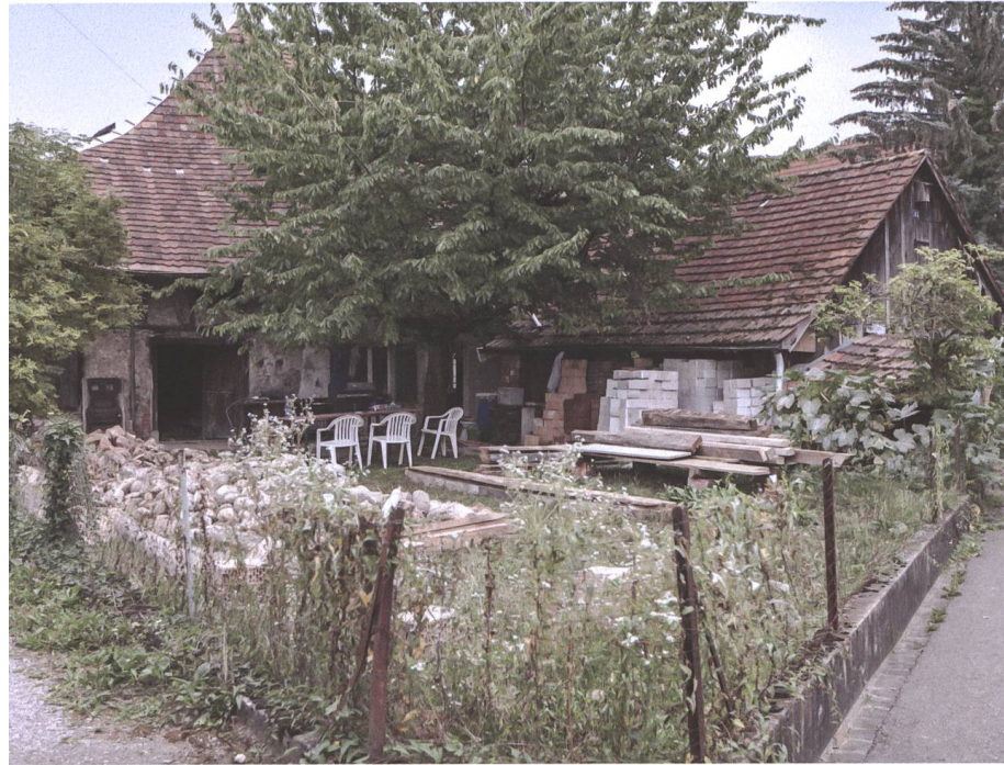
Abb. 4 Das Hochstudhaus an der Unterdorfstrasse 19 in Wallbach zu Beginn der Umbauarbeiten. Das Vollwalmdach verrät die Hochstudkonstruktion.

Die bereits 2018 begonnenen und 2019 abgeschlossenen bauarchäologischen Untersuchungen, die während des Umbaus des Bauernhauses Unterdorfstrasse 19 | Abb. 4 | in Wallbach stattfanden, ergaben ein in mehreren Bauphasen erweitertes Hochstudhaus, dessen Kernbau mit zwei bis drei Firstständern | Abb. 5 | mittels Dendrochronologie in das Jahr 1551/52 datiert werden konnte. Werner Fasolin als lokaler Bauernhausforscher hatte in den 1990er Jahren die altertümliche Bauweise erkannt und ein hohes Alter dieses Baus vermutet. Glücklicherweise musste dieser über 470 Jahre alte Hochstudbau nicht einem Neubau weichen. Das Ständerwerk des Kernbaus bleibt im umgebauten Haus erhalten, als Relikt eines der ältesten Hochstudhäuser des Aargaus.