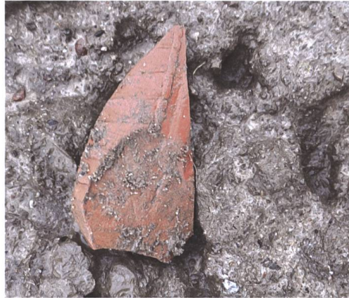
Abb. 3 Römische Terra Sigillata auf der Ackeroberfläche im Blauen bei Laufenburg.

Diese Funde sind eine weitere Spur zur Lokalisierung eines im Gebiet Blauen vermuteten grösseren römischen Gutshofes.