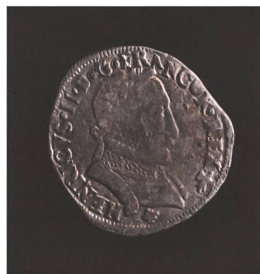
Abb. 9 Wallbach, Rheinstrasse 37. Silbermünze «Heinrich II, König von Frankreich, 1560», geprägt durch Franz II.

feuerversengte Oberflächen auf und war somit bis zum Zeitpunkt des Brandes in Gebrauch. Durch seine Geschlossenheit dürfte der Keramikkomplex von Wallbach für die Erforschung der frühneuzeitlichen ländlichen Sachkultur von Bedeutung sein. Zu erwähnen sind Ofenkachelfragmente mit renaissancezeitlichen Allegorien |Abb. 8|,