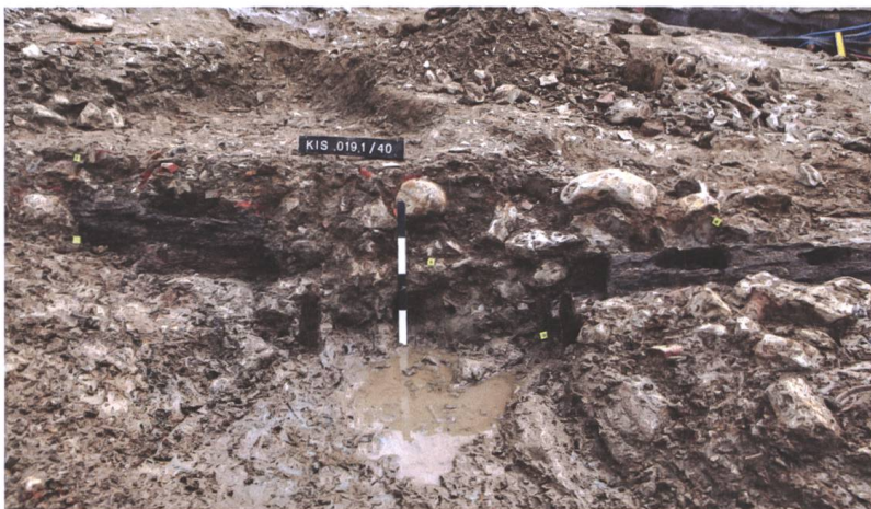
Abb. 1, 2, 11