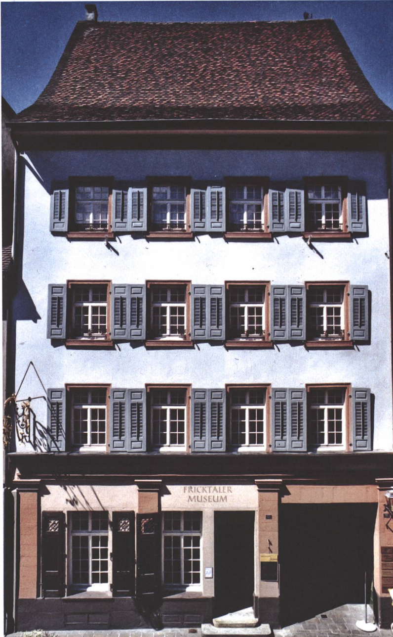
Fricktaler Museum Das ehemalige Gasthaus zur Sonne in Rheinfelden beherbergt heute das Fricktaler Museum.