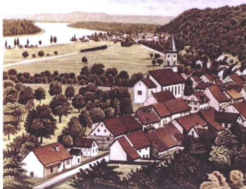
Abb. 6 Blick auf Oberschwörstadt um 1902.