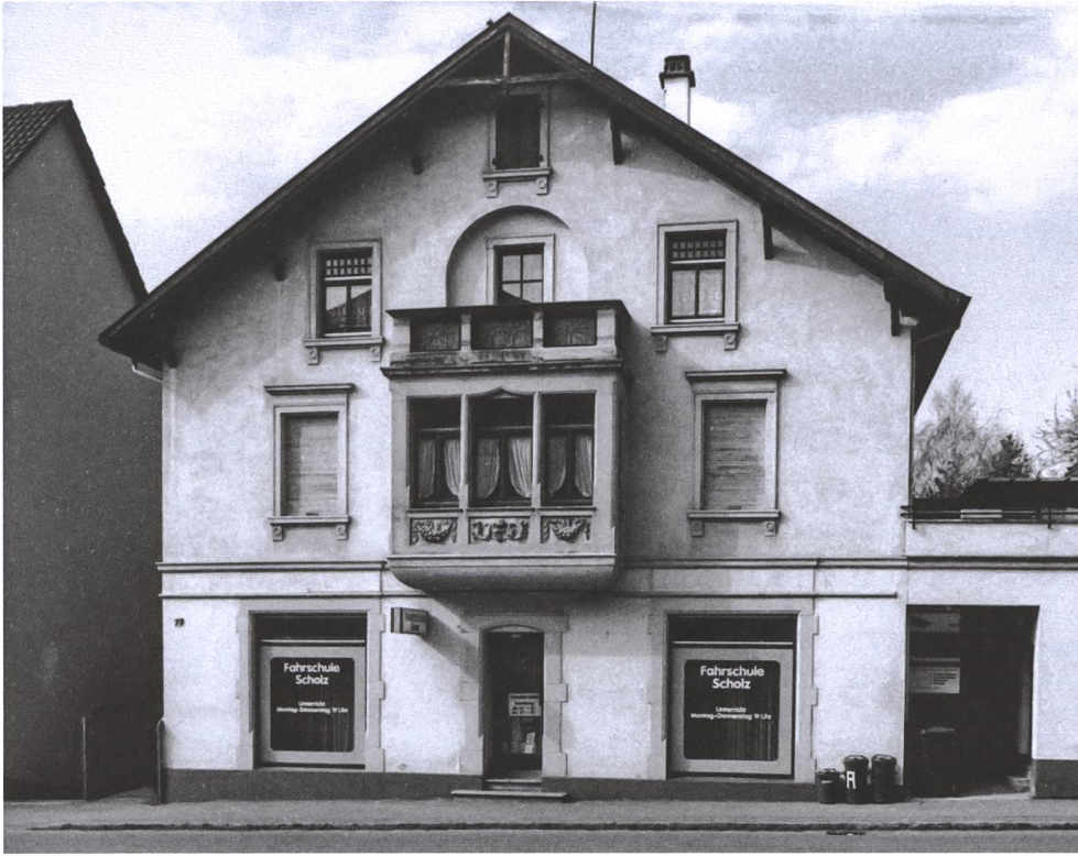
Abb. 8 Das Haus in der Bergseestrasse um 1990. Um diese Zeit wurden Marias Briefe gefunden.