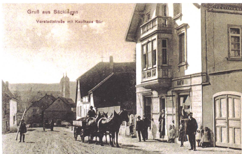
Abb. 2 Das Haus in der Bergseestrasse um 1910.