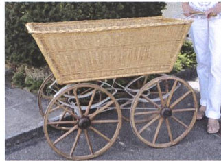
Abb. 6 Mit solchen Chaisen transportierten die Marktfahrerinnen im 19. und zu Beginn des 20. Jh. ihre Produkte auf den Aarauer Wochenmarkt.

fahrerinnen mussten in aller Frühe aufbrechen, damit sie um 7 Uhr ihre reichhaltigen Produktauslagen bestehend aus Früchten, Gemüse, Honig, Eiern und Butter auf dem Aarauer Wochenmarkt feilbieten konnten. Es war ein mehrstündiger Marsch auf staubigem Saumpfad. Im Herbst wurden Trauben angeboten und oft auch gewobene Bänder. Auch an den Viehmarkt wurde marschiert, oft wurde man sich schon vor Aarau handels-einig und mit einem kräftigen Handschlag wechselte das Tier den Besitzer. 12 In Erinnerung an die einstige Zugehörigkeit zu Österreich umschrieben ältere Einwohner die Reise in die Kantonshauptstadt noch zu Beginn des 20. Jahrhunderts mit den Worten: Ich go i d Schwiz ie. 13