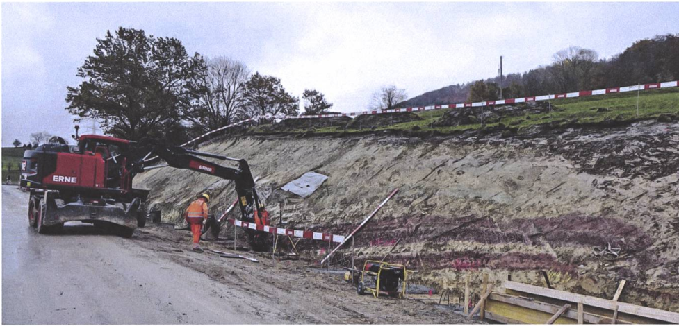
Abb. 3 Eine Plane bedeckt eine Saurierfundstelle auf dem Kaistenberg 2021.

ten das Massenaussterben. Die beiden Grossgruppen Synapsiden und Sauropsiden standen bereits im System des Perms in Konkurrenz. Und während erstere im Erdaltertum noch dominiert hatten, wurden sie im Mesozoikum in eine Nische verdrängt. Sie schrumpften zu kleinen, nachtaktiven Formen, ohne sich allerdings ganz verdrängen zu lassen. Ganz anders verhielt es sich mit den Sauropsiden. Während Trias, Jura und Kreide gehörte ihnen die Welt. Die Grossgruppe stand am Anfang der evolutiven Entwicklung der Dinosaurier, Krokodile, Flugsaurier und Schildkröten. Erst als vor 66 Millionen Jahren Asteroid und Vulkane das Leben der Dinosaurier beendeten, übernahmen die einzigen überlebenden Nachfahren der Synapsiden, die Säugetiere, wiederum die Vormachtstellung.