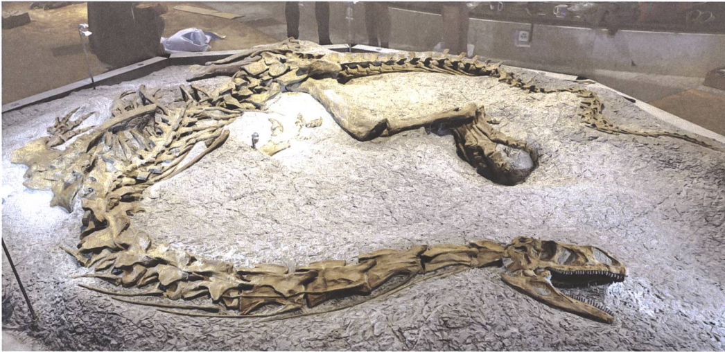
Abb. 4 Plateosaurier aus Frick im Zoologischen Museum der Universität Zürich.

baus der Kantonsstrasse über den Kaistenberg in den Jahren 2021 und 2022 wurde diese Ausdehnung weiter untermauert [Abb. 3]. Zwei Plateosaurier-Teilskelette und etliche Einzelknochen, geborgen aus zwei verschiedenen Schichten, erbrachten den Nachweis, dass sich die Grösse der gesamten Fundstelle nun gesichert über vier Kilometer Länge erstreckt. Gemäss bestehender geologischer Karten war grundsätzlich mit dem Vorhandensein der Oberen Bunten Mergel zu rechnen, ob sie jedoch auch fossile Knochen beinhalten, galt es herauszufinden. Die Grösse und insbesondere die Tatsache, dass bisher kein Nachlassen in der Funddichte festgestellt werden konnte, erhöht die weltweite Bedeutung dieser Fundstelle signifikant.