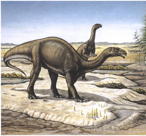
Abb. 1 Plateosaurier.