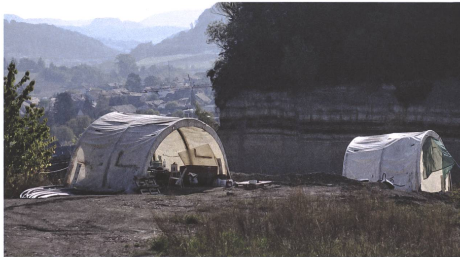
Abb. 2 Grabung auf dem Areal der bedeutenden Fundstelle Gruhalde 2019.

Teil bestand die damalige Landmasse aus einem einzigen Superkontinent – Pangäa. Dies ermöglichte die freie Wanderung und Besiedelung der Erdoberfläche, ohne durch ein Meer behindert oder gar gänzlich aufgehalten zu werden. Die geografische Lage von Frick war etwa auf dem 20. Breitengrad verortet – ein kleiner Fleck in einer grossen Schwemmebene.