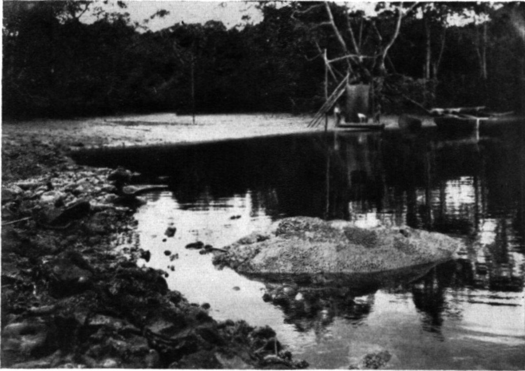
Fig. 1. — Récifs coralliens en bordure immédiate de marais à mangrove. Sédimentation organogène limitée, au milieu de la sédimentation paraliq. Intérieur de la baie de Balik Papan, près de Poeloe Balang (Est-Bornéo).