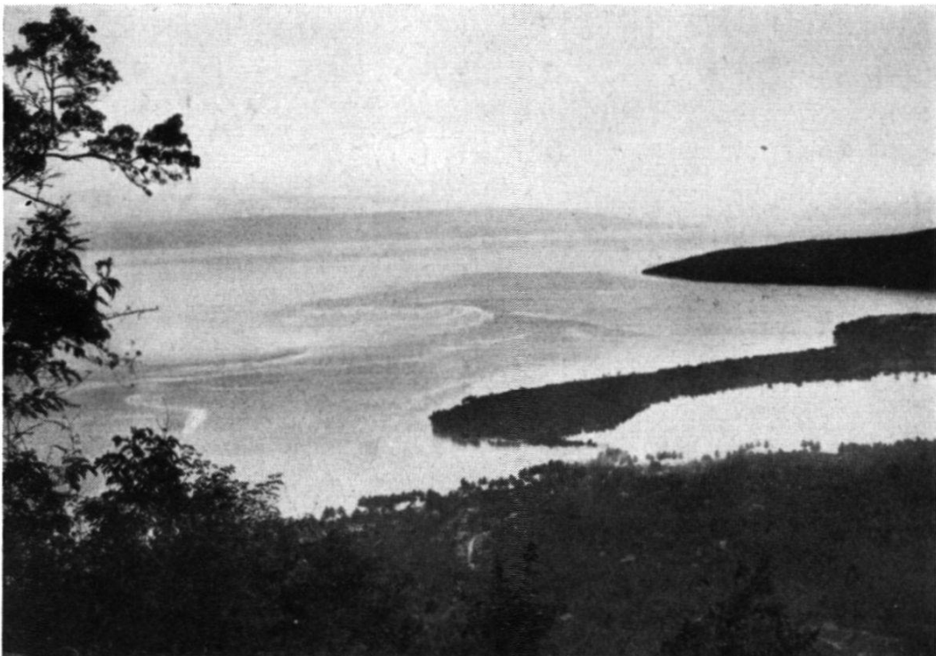
Fig. 2. — Côtes coralliennes de l'Est-Célèbes. Le long des rivages, récifs coralliens actuels, en partie légèrement submergés, avec chenal, en partie déterminant le lagoon de Loewoek. Photo prise à l'atititude de 400 m, sur les versants tapissés de récifs quaternaires surélevés. Au large, profondeur marine de 950 m, tout au fond, île de Peling (Archipel de Banggai).