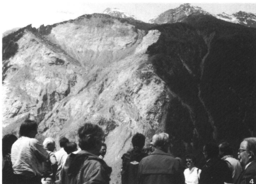
4. Der gewaltige Bergsturz von 1985 im Veltlin vom Gegenhang gesehen