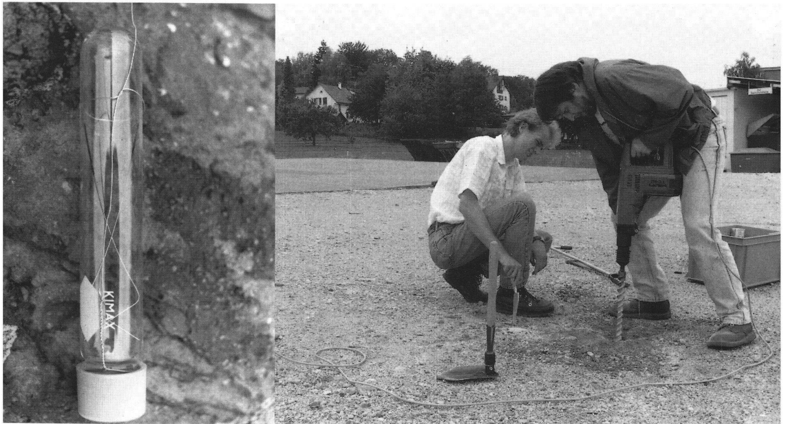
Figur 1: Erkundung einer Altlast mittels der PETREX Bodengas-Technik. Passivkollektoren mit Aktivkohle-Rezeptoren (rechtes Bild) werden in untiefe Bohrlöcher versetzt (linkes Bild).