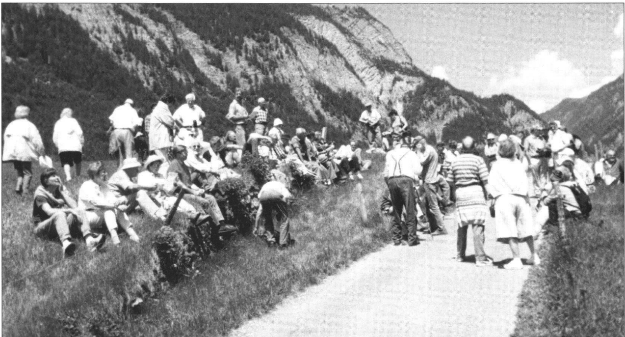
Fig. 5: 63. Tagung der VSP/ASP in Wildhaus (1996): «Tempora mutantur et nos mutamur in illis – Die Zeiten ändern sich und wir mit ihnen». Bluejeans sind zu Leitfossilien der Nachkriegszeit geworden. Mehr als 30 Geologinnen, Ehefrauen und Partnerinnen von Mitgliedern beleben das Bild.

oder weniger regelmässig an den Tagungen treffen. Besonders geschätzte Tagungsbesucher sind in dieser Beziehung die Professoren und Dozenten der geologischen Institute der Schweiz und des benachbarten Auslands. Als Referenten und Exkursionsführer bereichern sie das Tagungsprogramm und halten uns auf dem Laufenden über die neuesten Errungenschaften der Schweizer Geologie und der Erdwissenschaft. An der Tagung trifft sich der Professor mit seinen ehemaligen Doktoranden und Diplomanden, man erinnert sich an Goldene Zeiten und gönnt sich ein Glas vom Besseren.