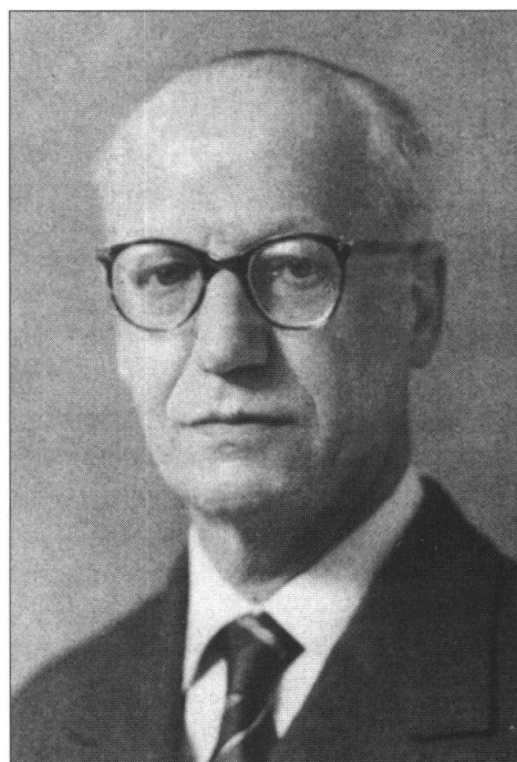
Fig. 2: Dr. Ernst Frei, Mitbegründer der VSP/ASP und deren Präsident von 1938 bis 1947.