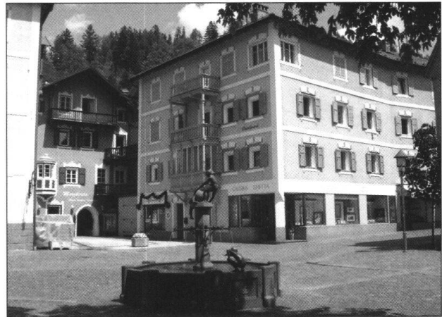
Fig. 4: St. Ulrich / Ortisei