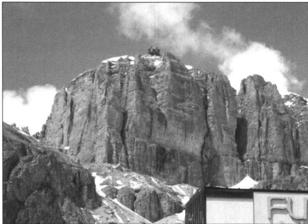
Fig. 1: Sass Pordoi

Die kommende Tagung bietet nicht nur geologische Leckerbissen ersten Ranges, sondern auch ein kulinarisches und touristisches Highlight, das Sie nicht verpassen sollten. Wir freuen uns und hoffen, Euch alle begrüßen zu können.