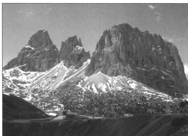
Fig. 3: Langkofel-Gruppe