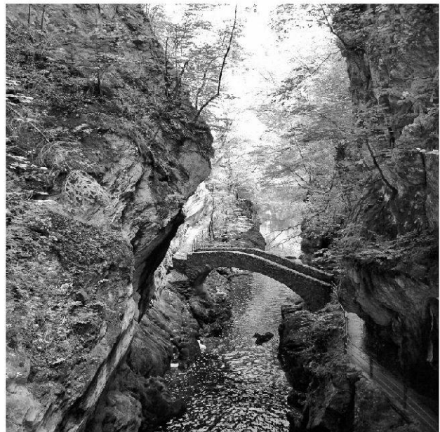
Fig. 3: Val de Travers, Schlucht der Areuse | Val de Travers, gorge of the Areuse river.

The final programme of the Annual Meeting and documents for the registration will be published on the Web Site ( www.vsp-asp.ch ).