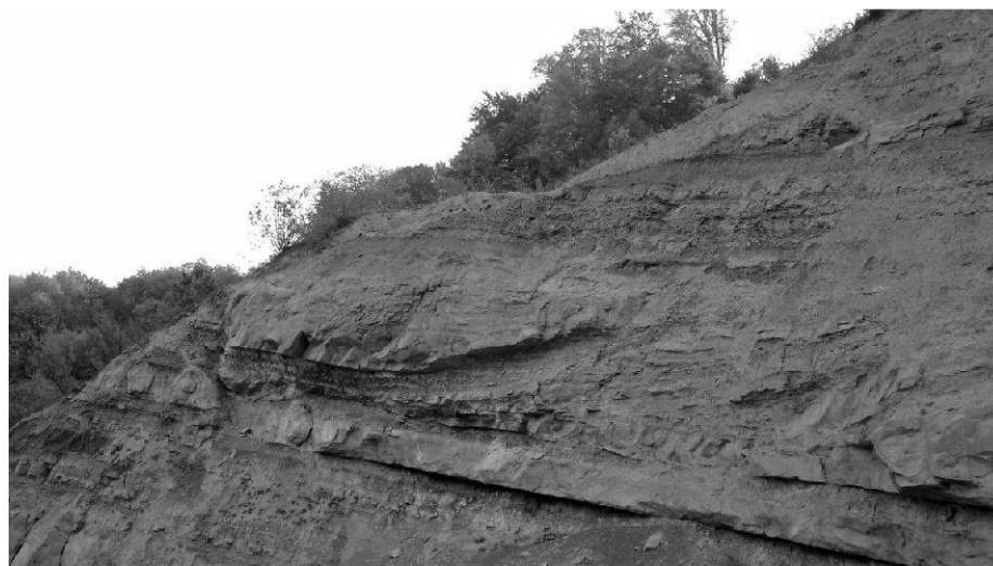
Fig. 2: Rinnen-Strukturen in Sandsteinen der Unteren Süßwassermolasse [USM], Steinbruch Eclépens | Channel-structures in sandstones of the Lower Freshwater Molasse [LFM], quarry of Eclépens.