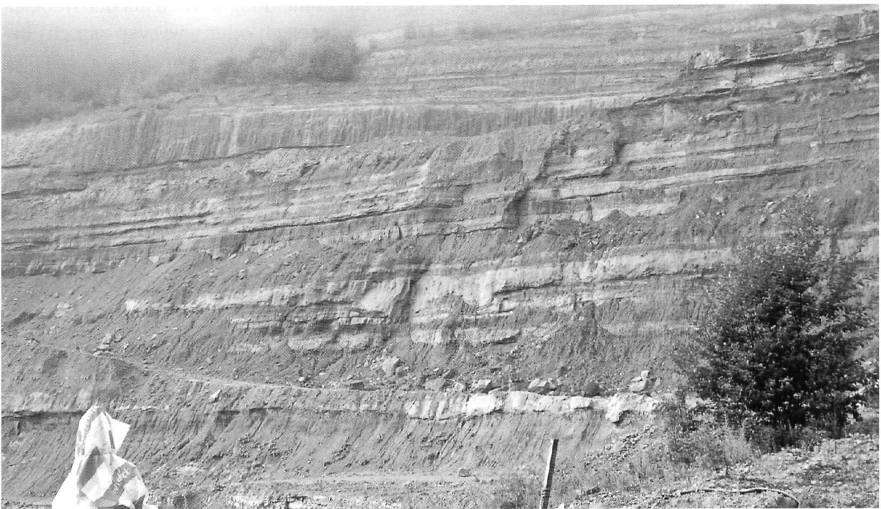
Fig. 3: USM Rinnen-Sandsteine in der Mergelgrube Weiherhof bei Roggwil.