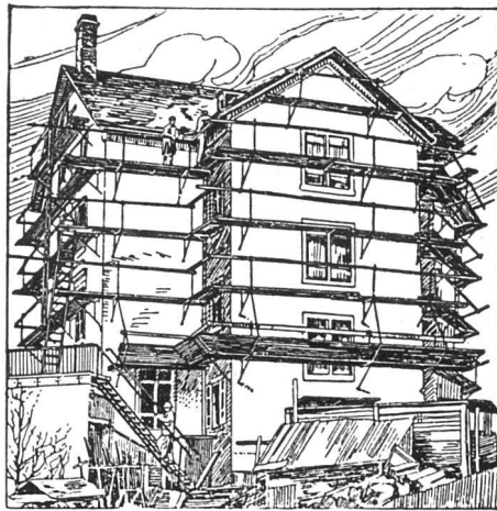
Ganz eingerüstetes Haus

Keine Gerüststangen, daher einfachstes Gerüstverfahren und bedeutende Ersparnis