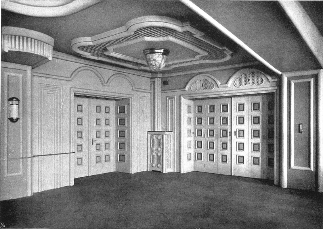
Volkshaus Bern. Arch. B. S. A. Otto Ingold, Bern. Ecke im großen Saal. Gips- und Malerarbeiten: Gips- und Malergenossenschaft Bern. Schreinerarbeiten: Fritz Wyler, Bern