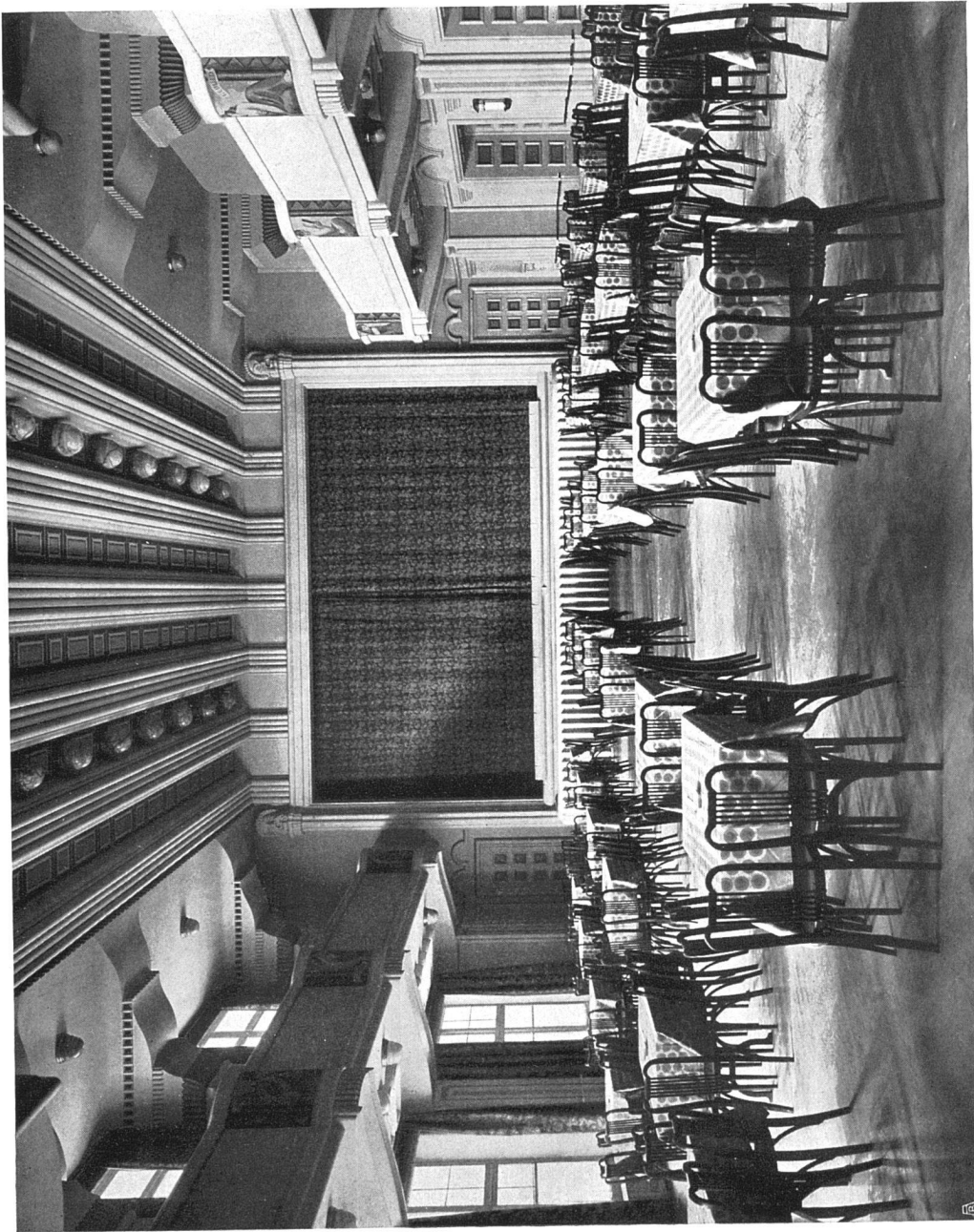
Großer Saal. Blick gegen die Bühne. Bühnenein- richtung: Alb. Isler, Zürich