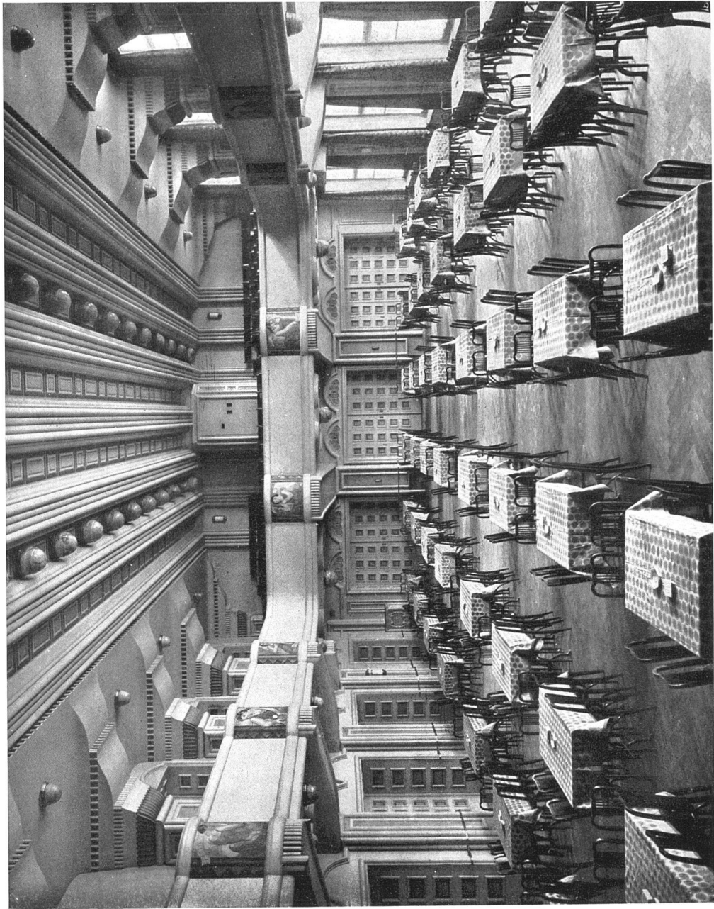
Volkshaus Bern. Großer Saal. Blick gegen die Rückwand Gips- und Malerarbeiten: Gips- und Maler- genossenschaft Bern. Bestuhlung: J. & J. Kohn, Basel. Tapezie- rerarbeiten: G. Hack, Bern. Beleuchtung: Baumann, Koelliker & Cie., Zürich. Schreiner- arbeiten: Fritz Wähler