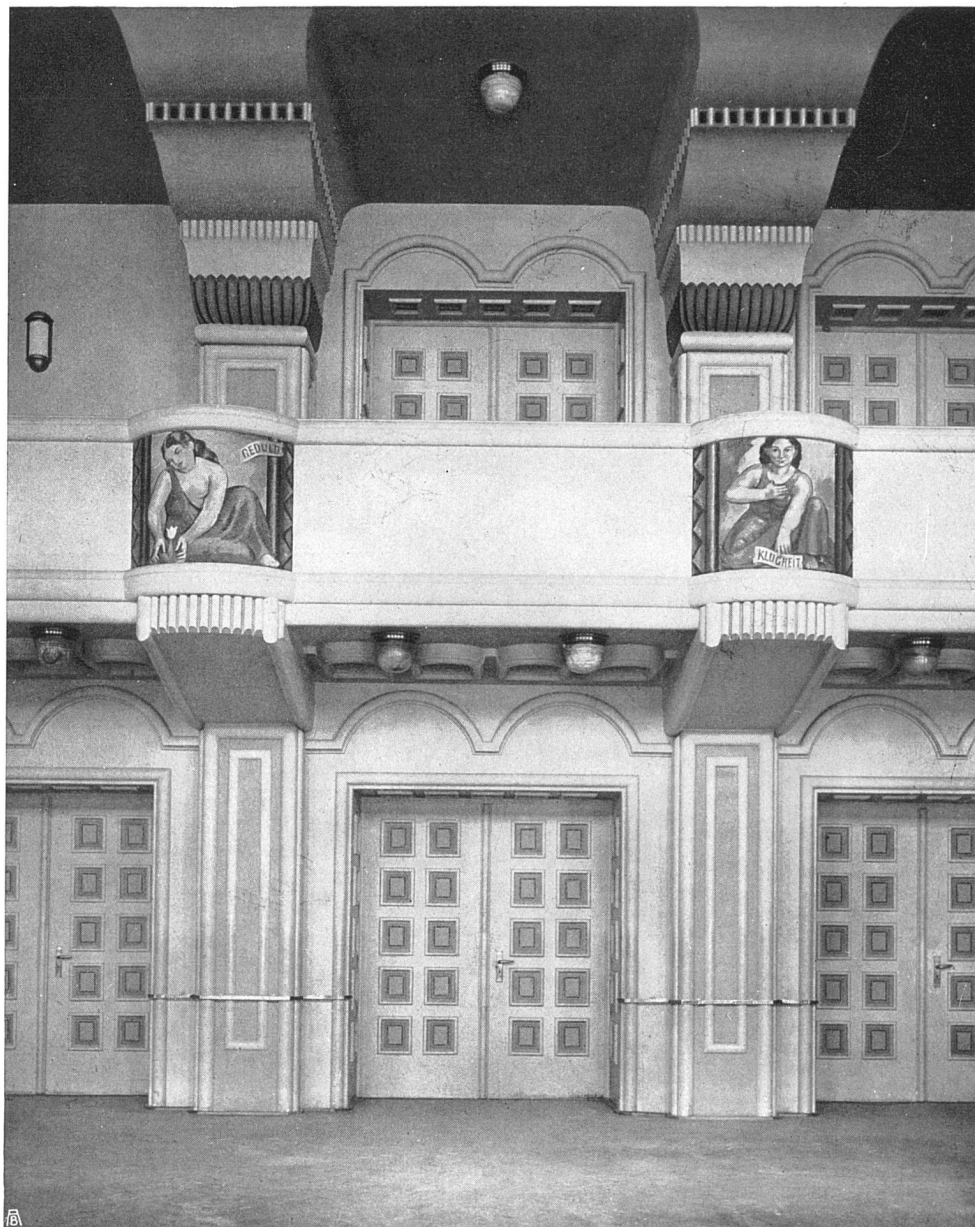
Volkshaus Bern. Großer Saal. Detail. Dekorative Malereien an der Brüstung der Galerie von Viktor Surbek, Bern. Schreinerarbeiten ausgeführt von Fritz Wyler, Bern

umschreibt er die Form einer Wanduhr, und aus dem räumlich Kleinen, wie aus dem Mächtigen spricht dieselbe Beschränkung auf das absolut Notwendige, Sinngemäße.