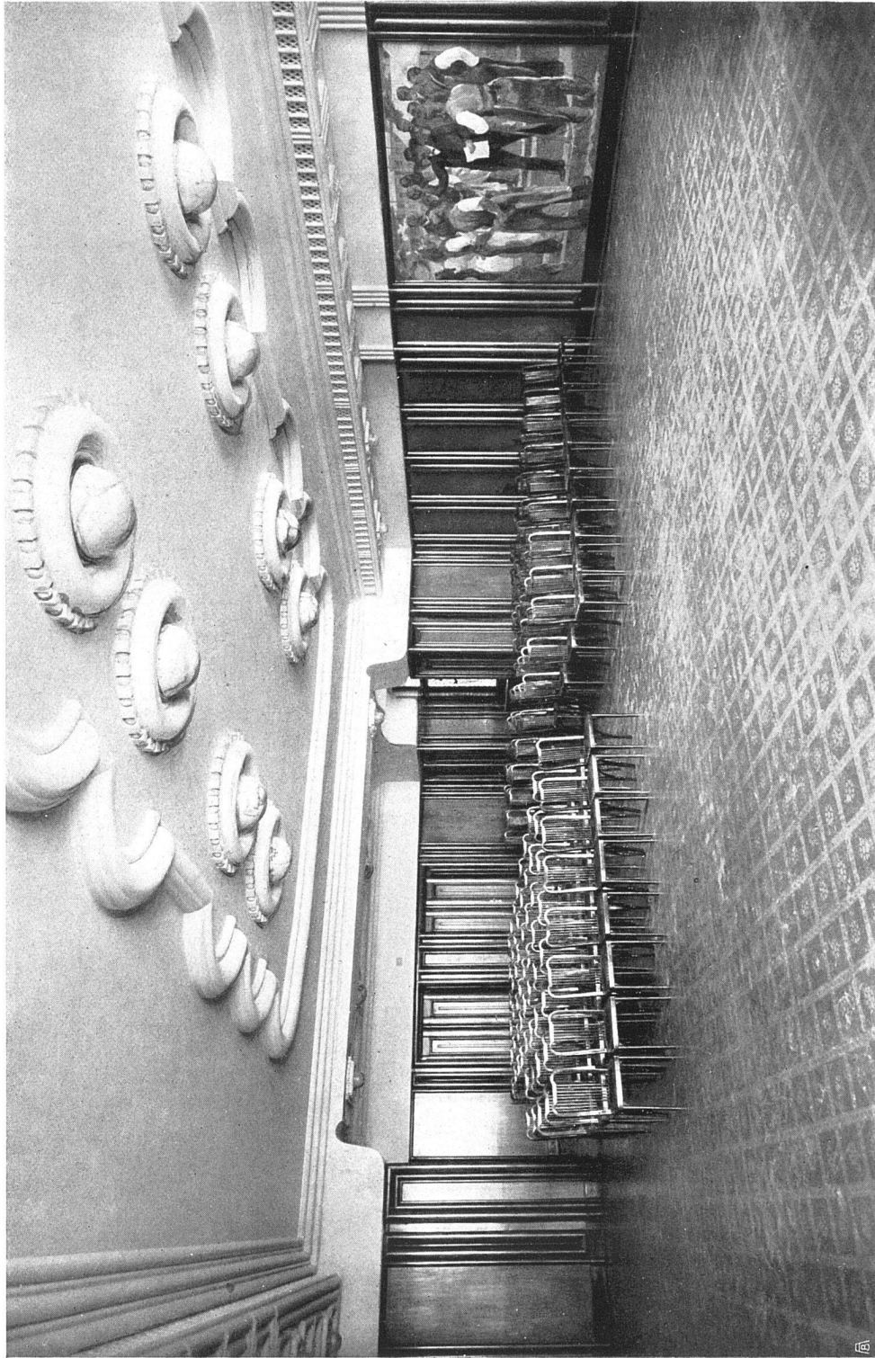
Volkshaus Bern. Unionsaal mit Wandbild von Eduard Boß, Bern. Linoleumbodenbelag; Entwurf von Otto Ingold; ausgeführt von der Bremer Linoleumwerk-Deimhorst-Schlüsselmarke, Basel