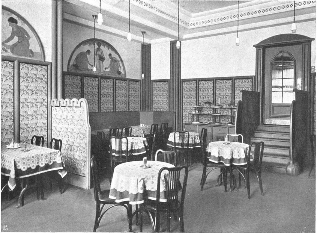
Volkshaus Bern. Alkoholfreies Restaurant. Tapeziererarbeiten: G. Hack, Bern Tischdecken und Stoffbespannung: Häusle, Wetter & Cie. S. W. B., Näfels

ihm hoch angerechnet werden. — Wir wollen auch heute nicht im einzelnen auf unsere Bilder eintreten, sie belegen das