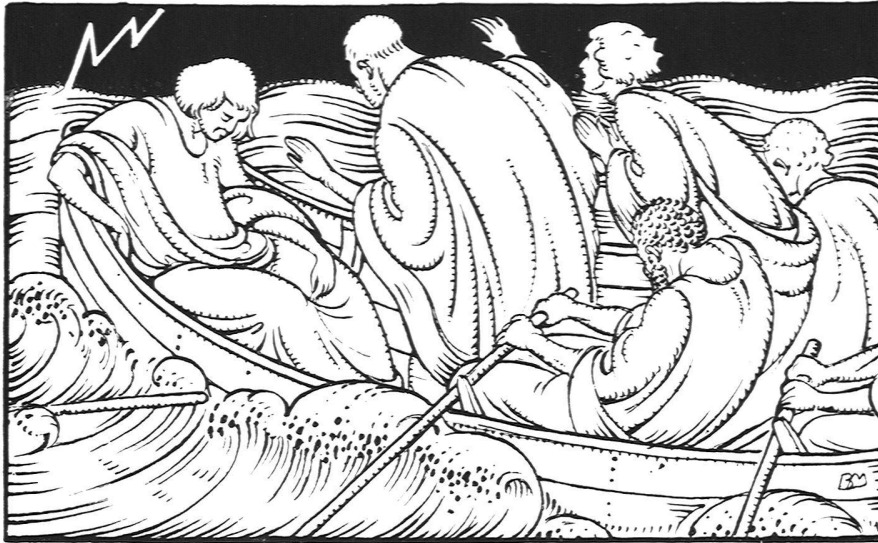
Illustration aus dem Gesangbuch für die evang. Kirche der Kantone Glarus, Graubünden, St. Gallen und Thurgau, von B. Mangold, Maler und Graphiker S. W. B., Basel. Verlag Huber & Co., Frauenfeld

auch die, welche sich um das neue Banner scharen, haben ihre Periode des Suchens, des unsicheren Tastens noch nicht abgeschlossen und ihr Schaffen hat sich noch nirgends zu genügender Bestimmtheit abgeklärt. Ihre künstlerische Energie steht auch in keinem Verhältnis zu den kühnen Befreiungsversuchen, durch die sich z. B. unsere Malerei aus den traditionellen Banden zu lösen wagt.