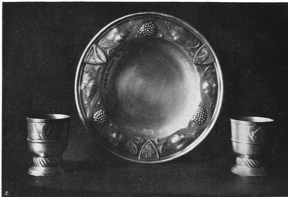
Handgetriebener Teller und Becher