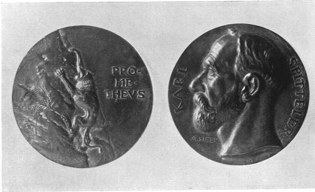
Spitteler-Medaille: Aug. Heer Bildhauer S. W. B. Arlesheim