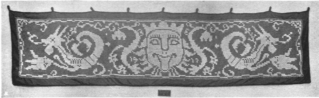
Filetbordüre, Entwurf: Fritz Baumann, Maler S. W. B., Basel, ausgeführt von Melanie Grieder, Basel. Unten: Filetbordüre, Entwurf und Ausführung von Irma Kocan, Basel

schen Mut haben, seine Überzeugung allen finanziellen Anfechtungen zum Trotz kräftig zum Ausdruck zu bringen. Man muß für seine Kunst, sollte es darauf ankommen, hungern und darben können, wenn man den schönsten Ehrentitel tragen will, den das Volk zu verleihen hat: Künstler!