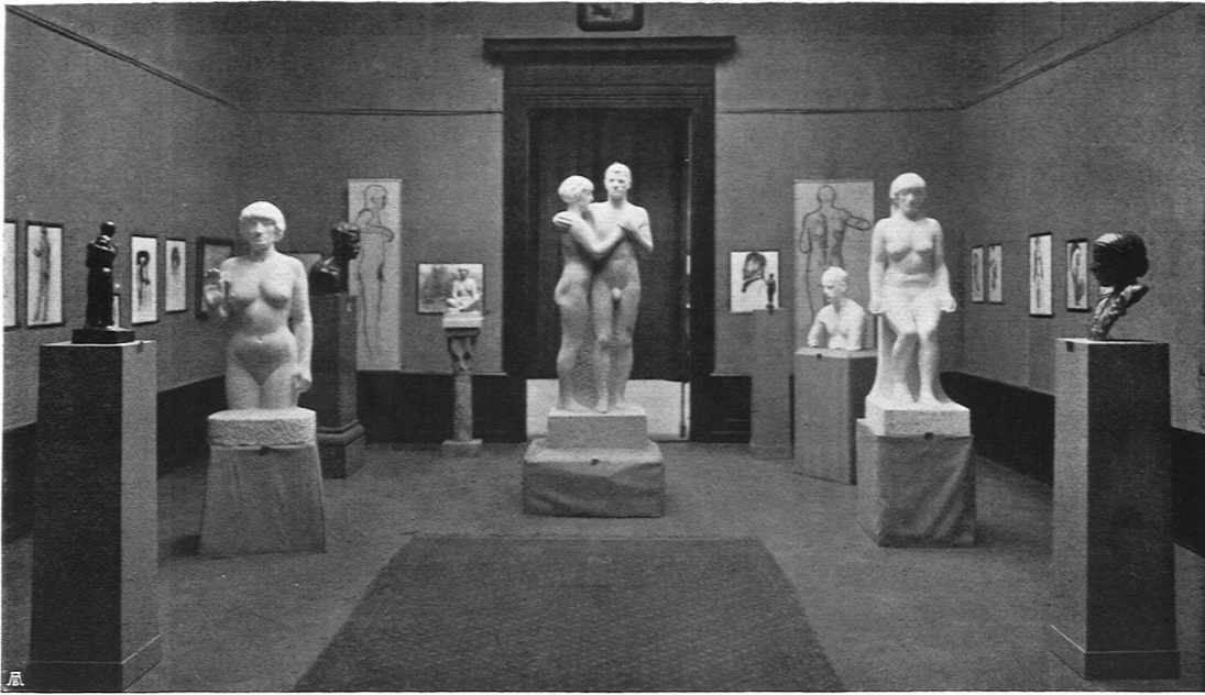
Otto Roos, Basel