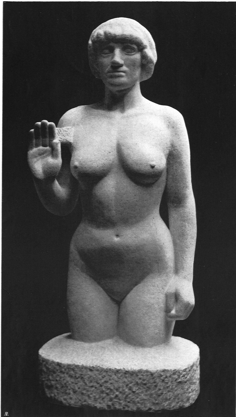
Otto Roos Basel