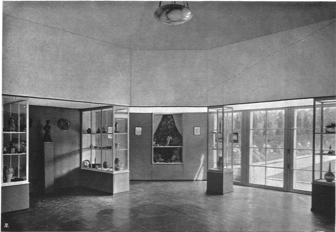
Halle für Kleinkunst mit zwölf Vitrinen, Architekt A. Altherr S. W. B., Zürich. Blick in den dekorativen Garten Beleuchtungskörper, Schale in Alabaster: Baumann, Koelliker & Cie. S. W. B., Zürich

ausstattungen und in einzelnen Stücken von Nutzmöbeln und Werken der Kleinkunst. Die Aufmunterung zur Schaffung von vorzüglichen Stücken der Gewerkekunst genügt uns keinesfalls. Die darin verwerkte Kraft soll weiter wirken, die darin verhaltene Freude kann Vielen, Generationen zur Freude werden. Die vom Schaffenden ursprünglich stark empfundene Freude wird für die Außenstehenden erst zum Wert mit dem Besitz. Und darin liegt unseres Erachtens der volkswirtschaftlich hohe Wert der Mitarbeit des Künstlers mit dem Gewerbetreibenden, daß die still verwerkte Freude unmittelbar zum Käufer, zum Besitzer spricht, seinen Sinn unvermerkt in eine bessere Geschmacksrichtung lenkt, die Bedürfnisse steigert, das Verlangen nach einer schönen Lebens-