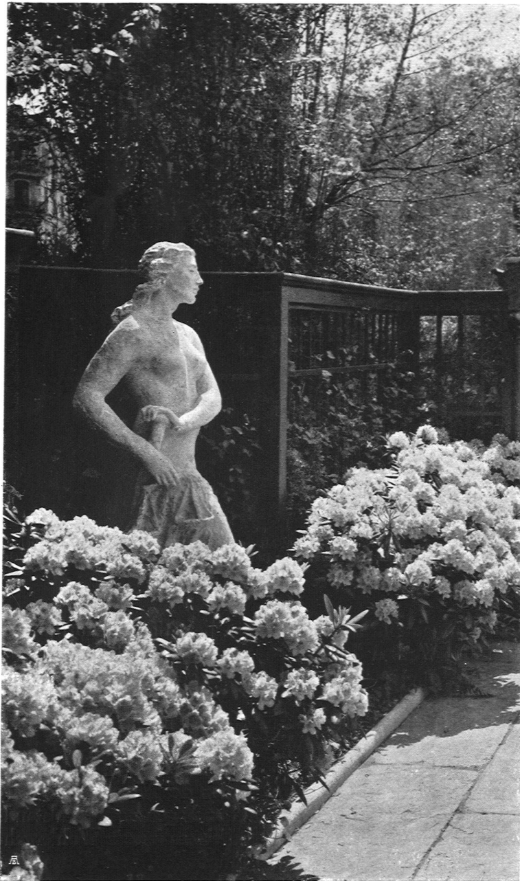
Plastik, Justitia, von Bildhauer H. Haller S. W. B., Zürich

waren eng bemessen auf Raumkunst, Kunstgewerbe. Mit der Münchner Gewerbeschau 1912 machte sich das Bedürfnis nach einer Umsetzung geltend, nach der Bestimmung des Verkaufs.