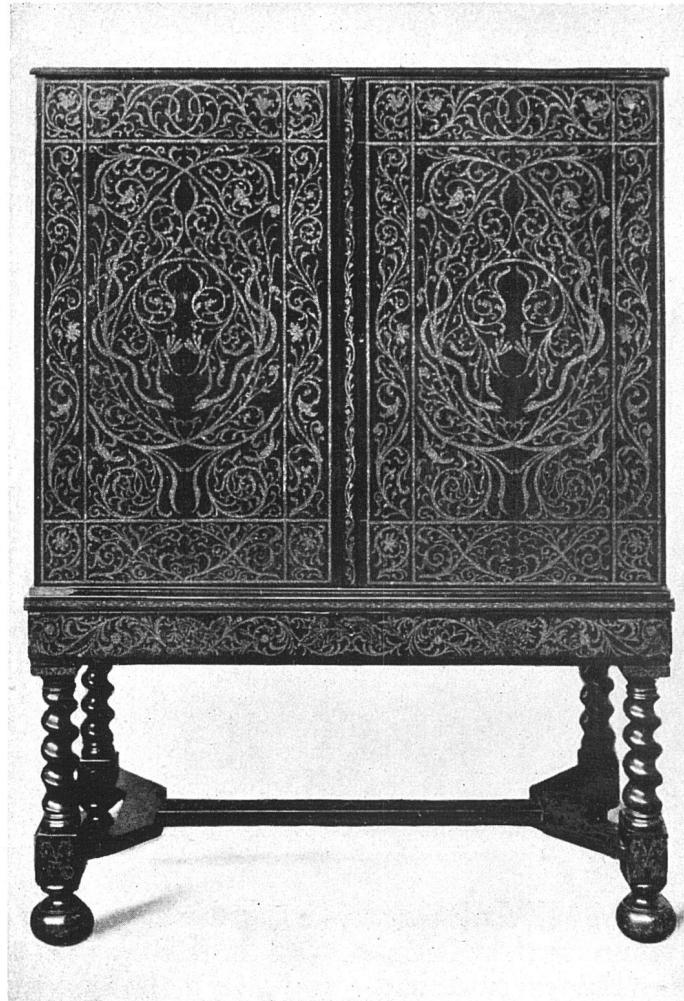
K. Sluyterman Huisvaad en Binnen- huis in Nederland 's Gravenhage Martinus Nijhoff

dabei die einfache, handwerksmäßig schlichte und doch große dekorative Linie, die ihr Gesetz in sich hat und darum auch im Gedächtnis haften bleibt.