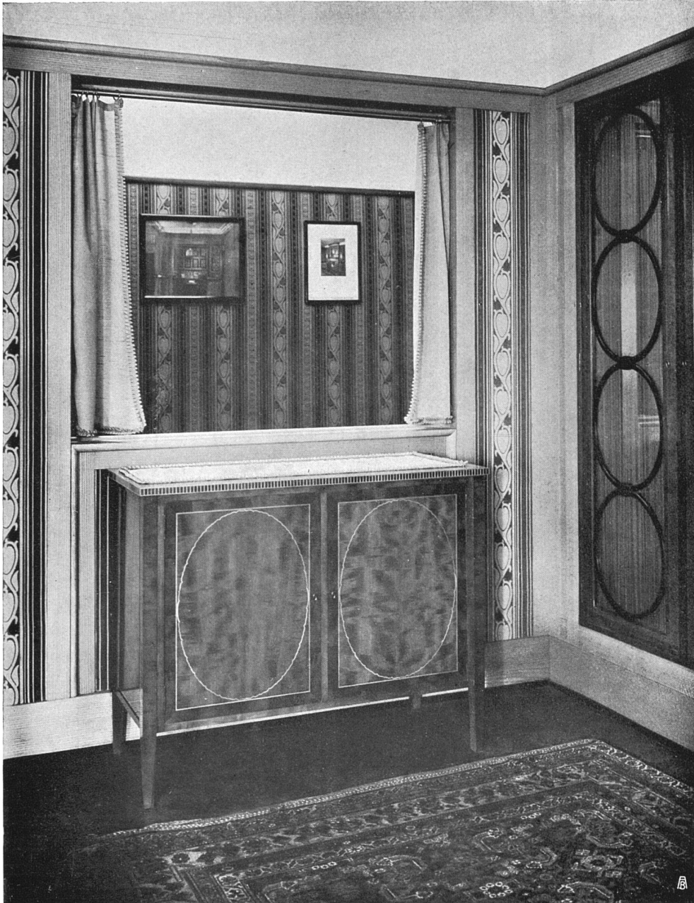
Zimmer einer Dame. Birnenholz mit Buchsbaum- und Zitronenholz-Intarsien. Entwurf: Architekt O. Ingold B. S. A., Bern. Ausführung: Hugo Wagner, Werkstätten für Innen-Einrichtung S. W. B., Bern