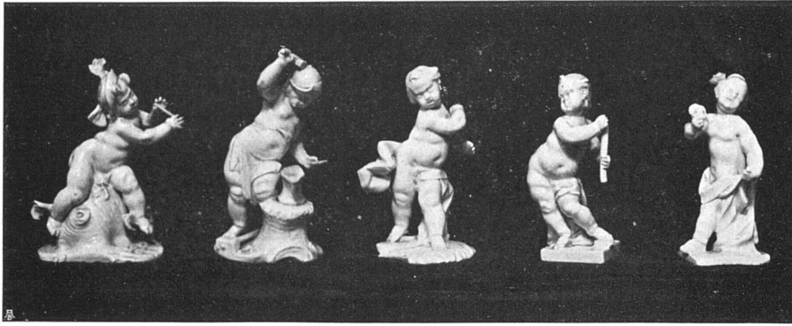
Fünf Porzellan-Putten von Bastelli, Nymphenburg 1755–1765

körpers folgt, abgegrenzt durch eine zierliche Balustrade, ein luftiges, durch Doppelsäulen belebtes Glockengeschloß. Als Abschluß hat der Turm, nach mannigfaltigen Erwägungen und Ausprobierungen, eine mit Kupferblech bezogene, mehrfach gestufte und gebrochene Helmkrone erhalten.