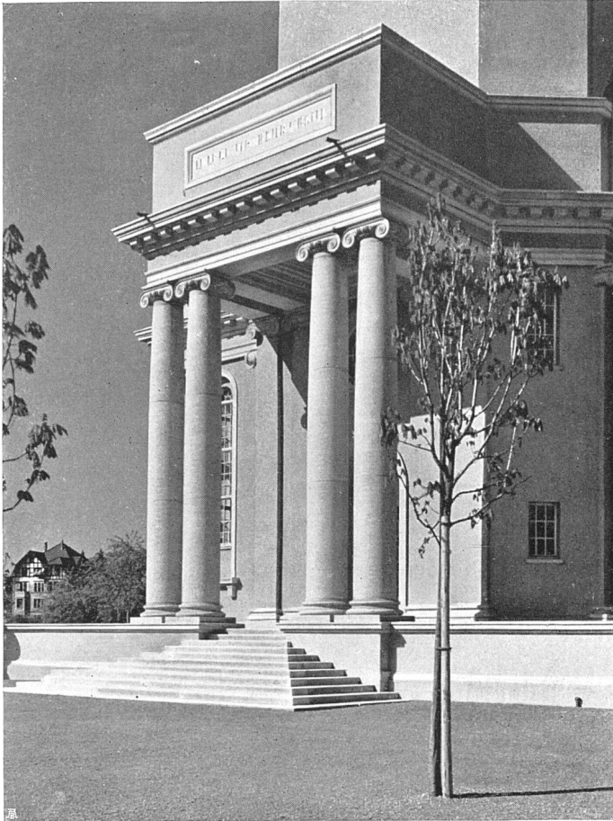
Detail vom Eingang