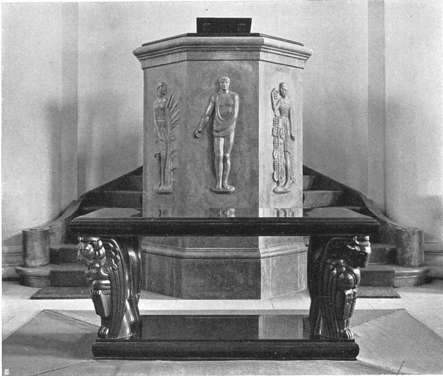
Kanzel und Taufstein. Bildhauer August Suter, Zürich Unten: Grundriß der neuen Kirche Fluntern