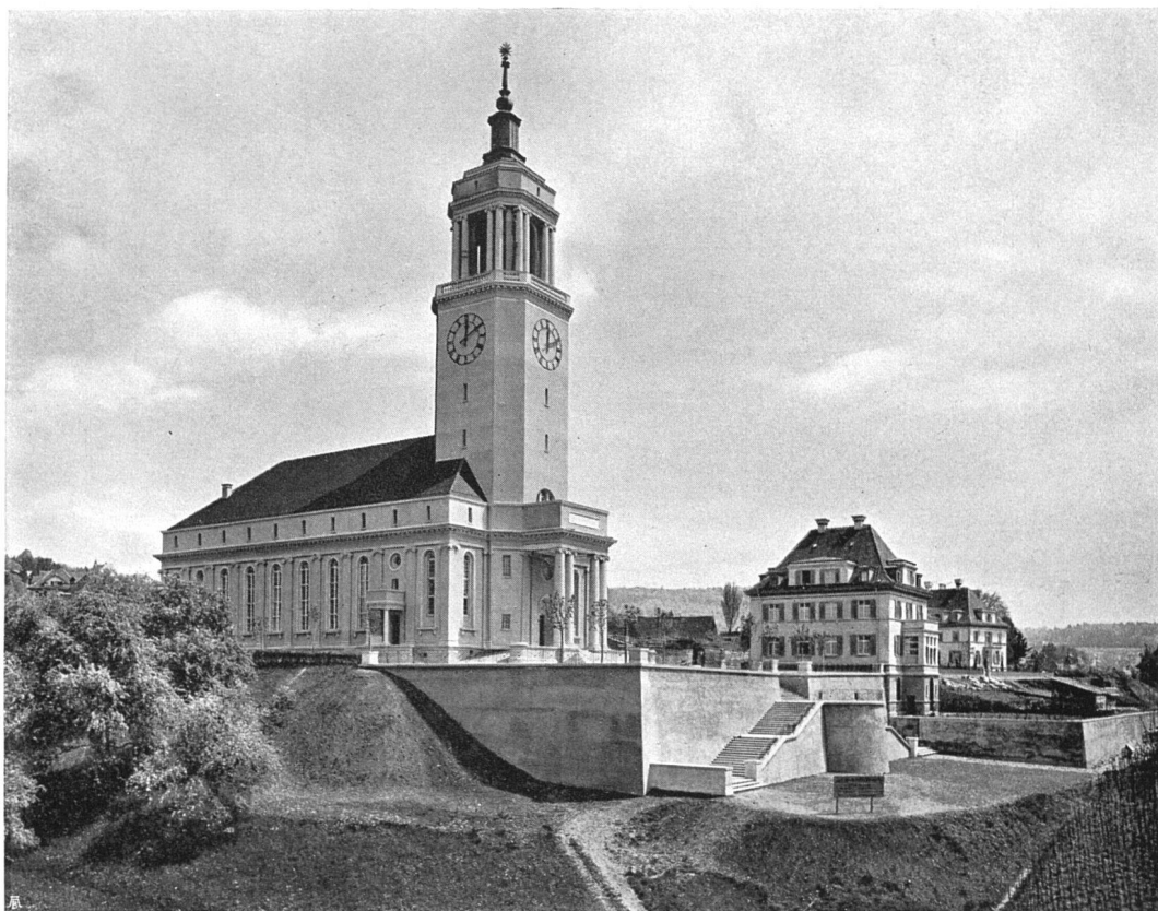
Kirche Fluntern. Gesamtansicht des Quartiers mit Terrasse und Aufstieg. Architekt Prof. Dr. K. Moser S. W. B., Zürich