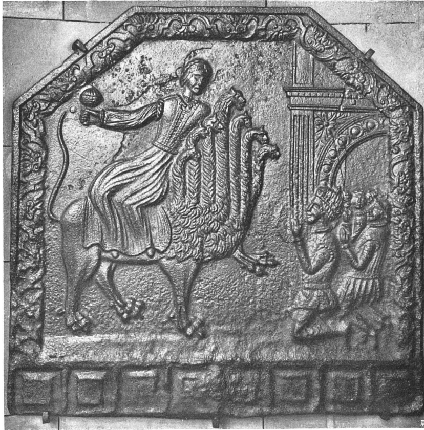
Gußeisenplatte von einem Ofen, Schweiz. Landesmuseum Zürich

lungen. Ja, man wird behaupten dürfen, die eigentliche Stärke der modernen Baukunst liege in dieser organisatorischen Gabe der Grundrißgestaltung. Von dieser besonderen Seite betrachtet, vermag die moderne Baukunst ein erhöhtes Interesse zu erregen, ein Interesse allerdings, das sich, der Natur der Sache nach, in erster Linie an den Fachmann wendet, und das in seiner Auswirkung wohl auch auf den engeren Kreis der Fachleute beschränkt bleibt. In der Grundrißkunst hat sich die moderne Baukunst als sehr geschickt erwiesen. Sie hat auf diesem Gebiet Leistungen vollbracht, von denen mit größtem Respekt zu sprechen ist. In den vielfach zusammengesetzten Bauplänen sind die gesteigerten Raumanforderungen nicht nur vollauf erfüllt, es ist auch die Vielheit der geforderten Räume in übersichtlicher Weise zu einem klaren System geordnet. Die Räume sind,