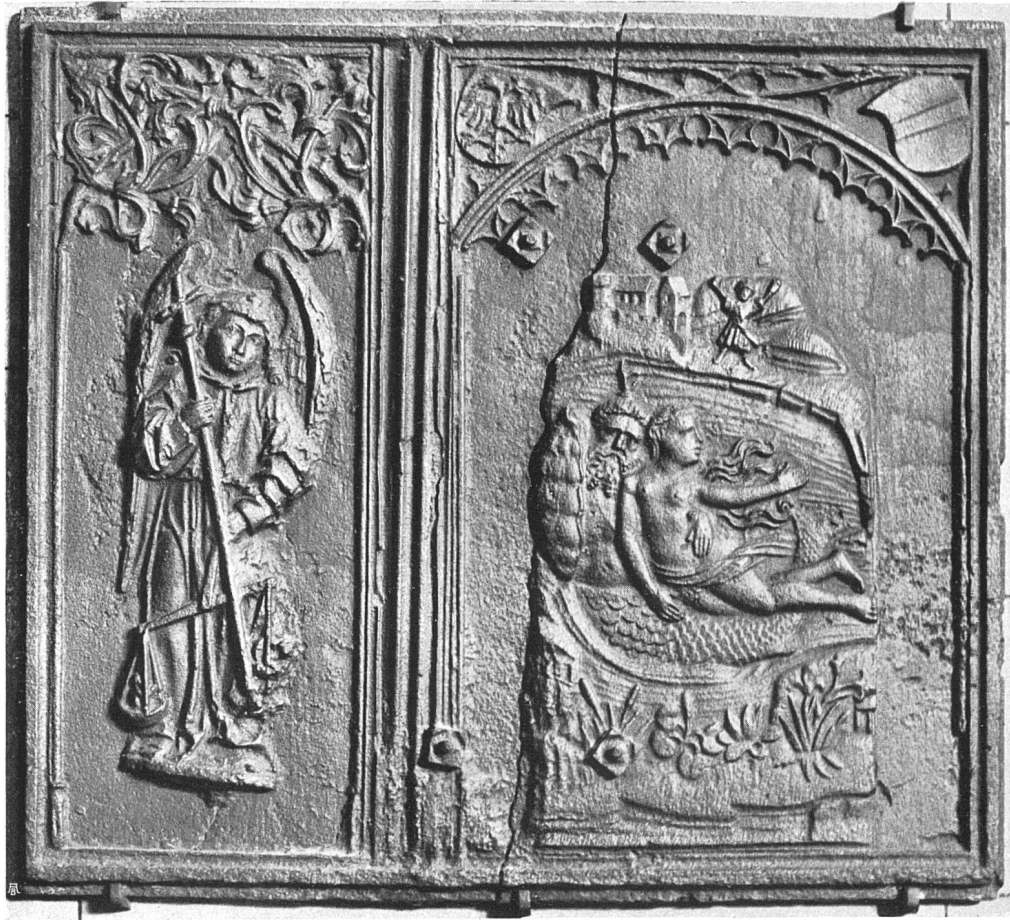
Seitenplatte eines gußeisernen Ofens, Schweiz. Landesmuseum Zürich

Und in der Vielräumigkeit ihrer Pläne hat sie ein gleichwertiges Gegenstück nur noch in den ausgedehnten Bauanlagen des alten Rom, in den Palästen, den Zirkusbauten und Thermen der Kaiserzeit mit ihren endlosen Raumfluchten, mit ihren Säulenportiken, Galerien und hochgewölbten Hallen für Spiele und Leibesübungen. Und der römischen Baukunst gleicht die Archi-