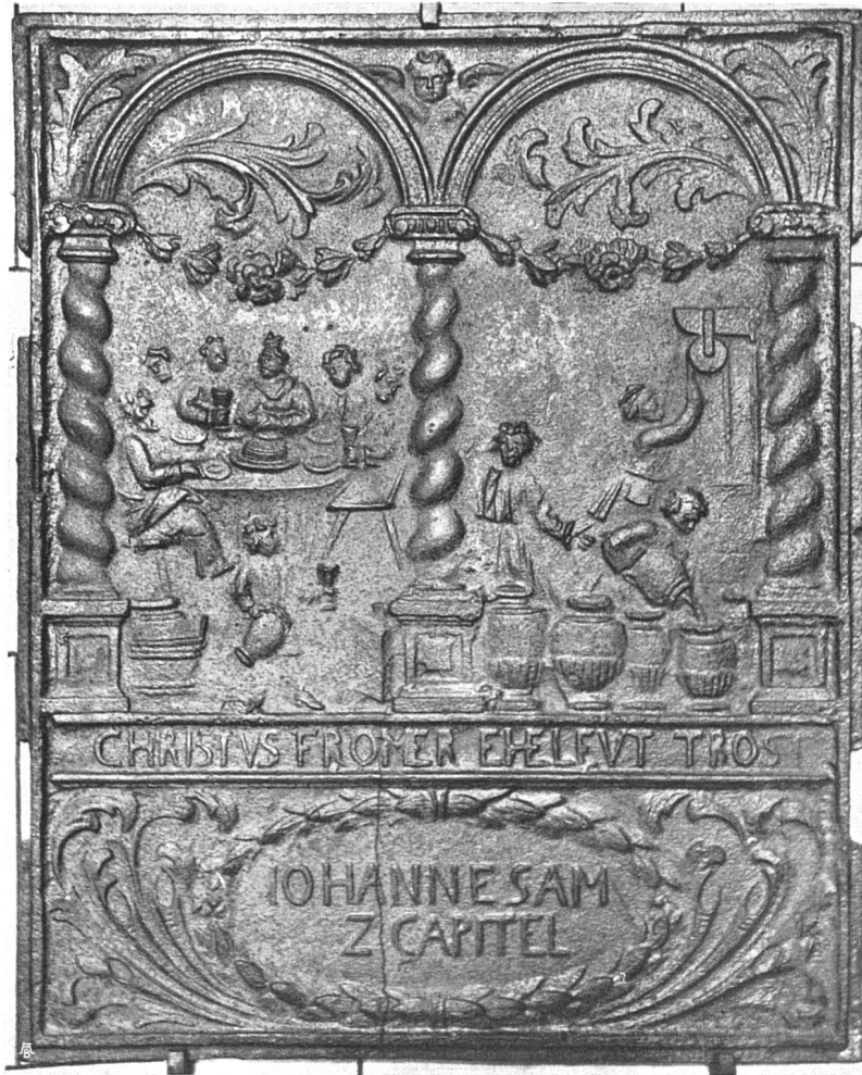
Seitenplatte eines gußeisernen Ofens, Schweiz. Landesmuseum Zürich

den vielgliederten Raumkombinationen und in den kühnen Konstruktionsideen offenbart, häufig sogar in auffallendem Gegensatz.