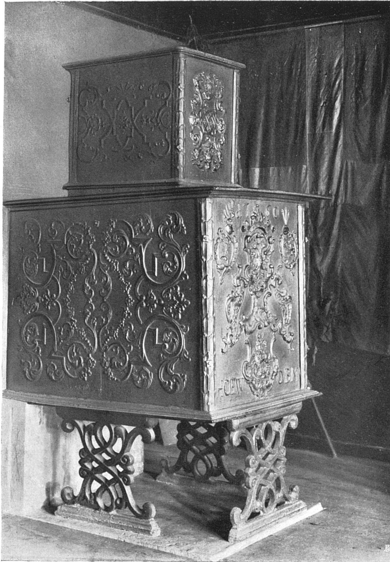
Alter Gußeisenofen im Rathaus in Stein a. Rhein

neuester Zeit mehrfach bereits zu einer Auflösung der Gesamtanlage in einzelne kleinere Gebäudegruppen geführt. Es sei hier, um nur ein Beispiel zu nennen, an die großartigen Universitätsbauten Amerikas erinnert, die sich mit ihren Hörsaal- und Studiengebäuden, mit ihren Wohnbauten, Gymnasien, Turnhallen, Wirtschaftsgebäuden und Kraftzentralen förmlich zu kleinen Städten ausgewachsen haben.