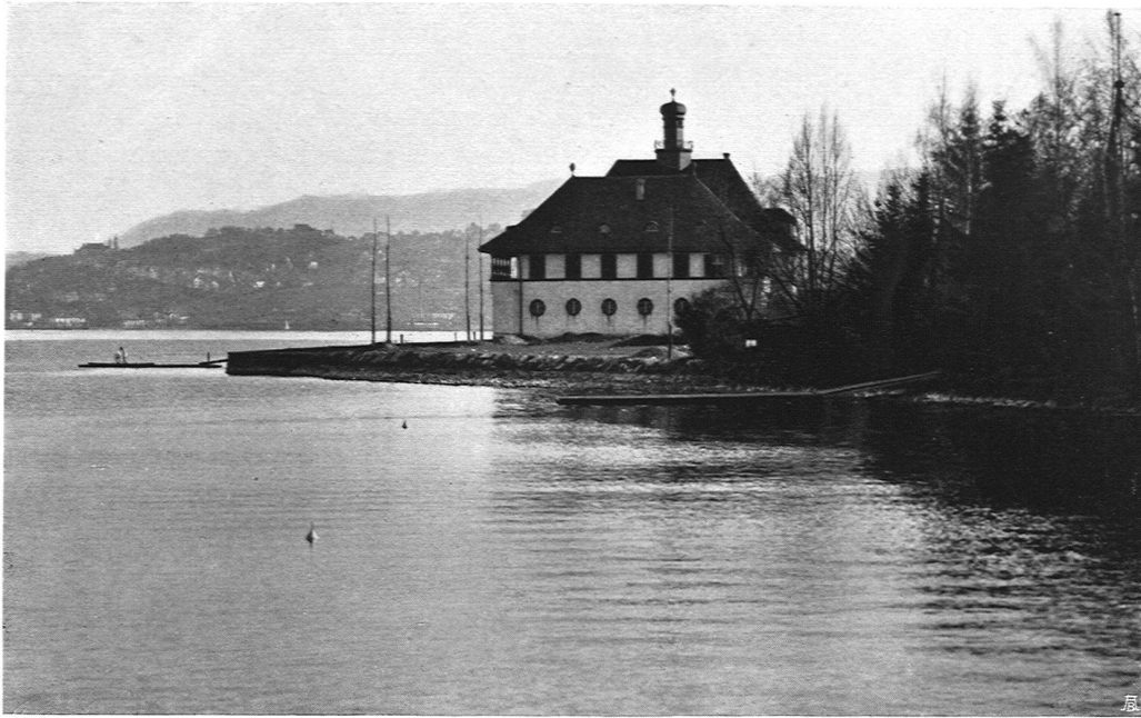
Bootshaus am Mythenquai, Grasshopper Zürich. Architekt Albert Frölich B. S. A., Zürich

darin, sie gut auszuführen. Die Betätigung seiner höchsten Eigenschaften oder Kräfte ist der Stolz des menschlichen Seins, und ihre Entdeckung, ihre Entwicklung durch beständige Anwendung übertrifft jedes andere Vergnügen. Aber nicht alle Arbeit gehört zu dieser Sorte; bei den meisten gibt es noch viel Plackerei, so daß wir zeitweilig von dem lebhaften Wunsche, uns davon loszumachen, befallen werden. Wir scheinen es nicht zu tun, weil wir ein besonderes Talent oder eine besondere Gabe dafür haben, sondern weil wir uns zufällig auch nicht besser für etwas anderes eignen. Diejenigen, welchen ihre Lebensaufgabe durch die Notwendigkeit auferlegt wurde, mögen wohl fühlen, daß das Ringen nach etwas, das nicht Arbeit ist, nach Gelegenheit zur Erholung, nicht allein berechtigt, sondern ein Pflichtgebot ist. Andererseits, sofern vollständiges Nichtstun möglich ist, werden wir durch das Gefühl der Verschwendung, oder der unbenützten Kraft gequält, durch den Gedanken, daß alles zu nichts führt, unter dem Druck von Zufalls-