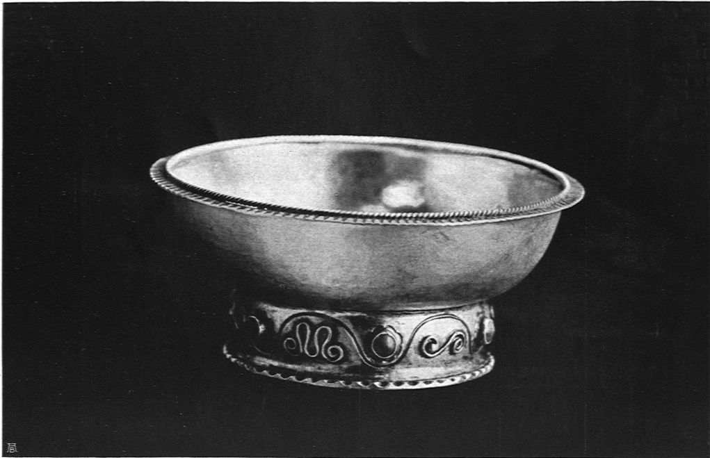
Tennispreise. Damenpreis Schale mit Korallen. Unten: Becher in Silber getrieben, Internationales Tennistournaments Luzern, A. Stockmann & Co., Edelmetallwerkst. S.W. B., Luzern. Stiftung: Mme. Vischer, Meggen

wo niemand sie zwingt und treibt, sich freiwillig unerhörte Strapazen aufpacken und körperliche Rekorde aufstellen. Und sogar wir, die das Verhängnis plagt, nichts bloß eben so obenhin machen zu können, und die wir uns darum auch bei untergeordneten Beschäftigungen, wenn wir sie einmal übernommen haben, abnutzen und ausfransen: sogar wir stürzen uns auf freie Tage mit athletischer Wut und rasen los, als würden wir dafür bezahlt.