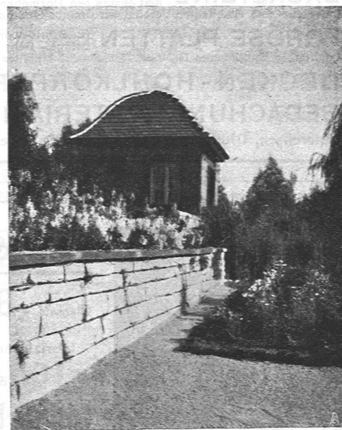
A. Bodmer, Zürich-Wollishofen Gartenbau

Projektierung und Ausführung von Garten- und Parkanlagen, Umänderungen, Pläne und Kostenberechnungen