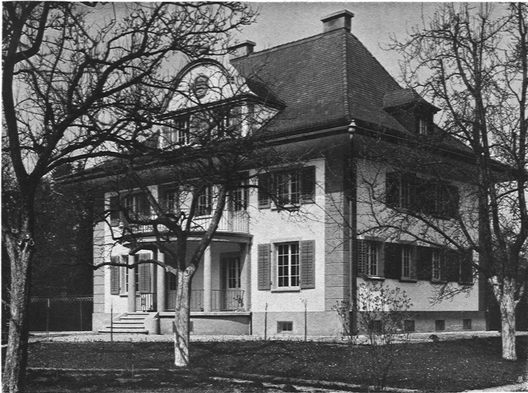
Haus Dennler-Zurlinden, Langenthal. Gesamtansicht vom Garten her. Architekt Hector Egger B. S. A., Langenthal