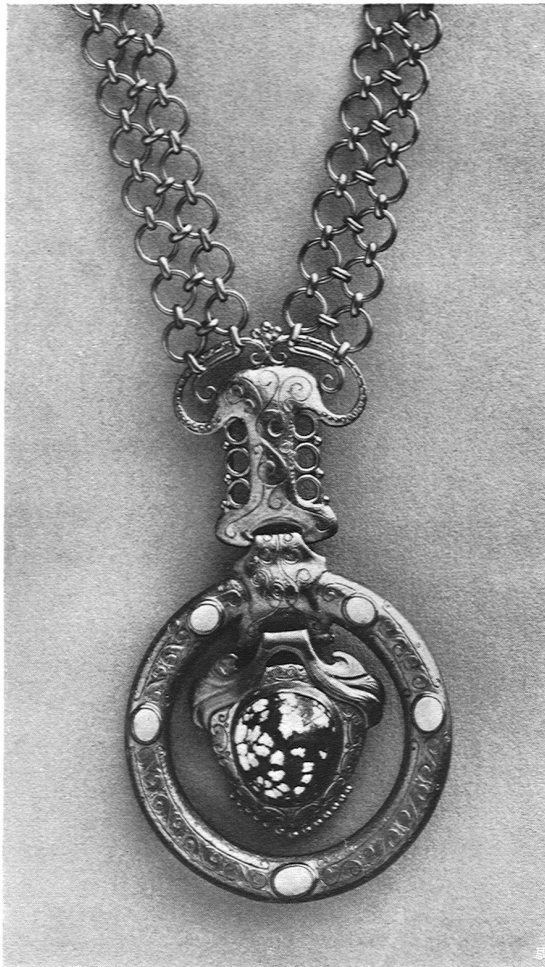
Pendentif or avec turquoises matrixes et fines Ern. Ræthlisberger, artiste bijoutier O. E. V., Neuchâtel

ainsi que des représentants de la Banque Nationale Suisse, ces derniers avec voix consultative.