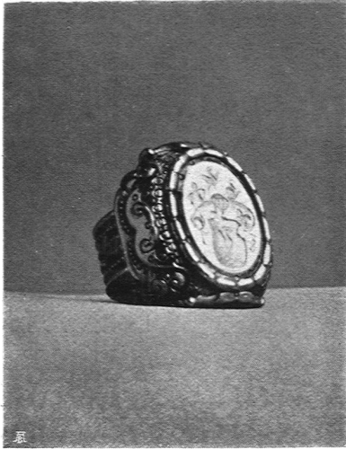
Bague cachet or et argent (cachet argent) Bague or et turquoise matrix Ern. Roethlisberger artiste bijoutier, Neuchâtel