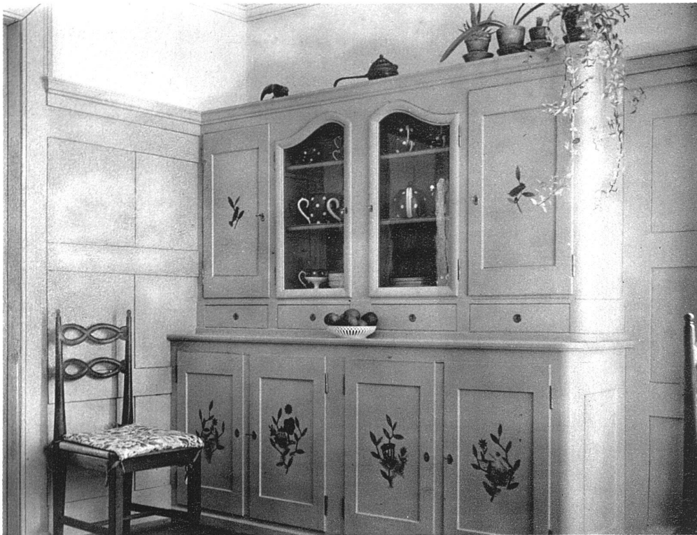
ABB. 3 UND 4 WOHN- UND ESSZIMMER AUS EINEM LANDHAUSE IN WINTERTHUR ENTWURF VON WILHELM KIENZLE S. W. B., ZÜRICH ORNAMENTALE BEMALUNG VON FRAU J. PAULI-BRUPPACHER S. W. B. AUSFÜHRUNG DURCH H. KÄGI, SCHREINER, SEEN BEI WINTERTHUR