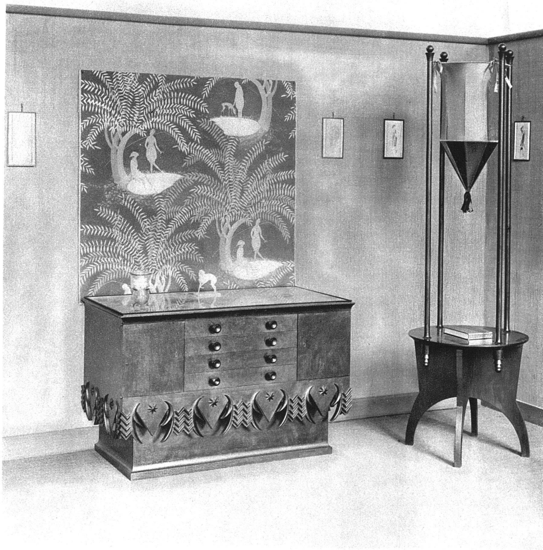
ABB. 5 KREDENZ UND LAMPE ENTWURF VON OTTO ZOLLINGER S.W.B., ZÜRICH (1919) WANDBEHANG VON FRAU FREDA ZOLLINGER S.W.B. AUSFÜHRUNG DURCH DIE SCHREINEREI HUMMEL, GOTTLIEBEN