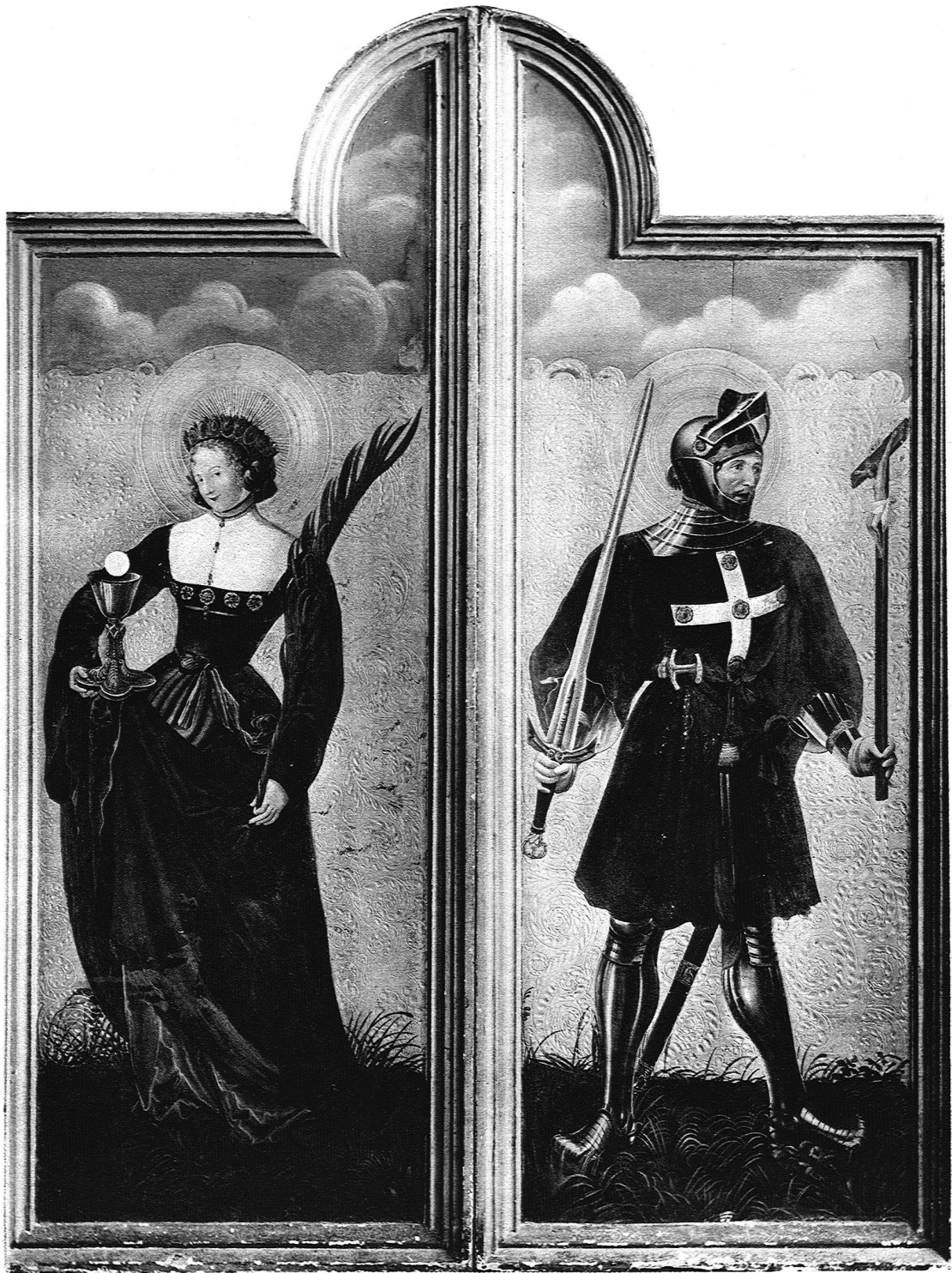
A B B. 24 NIKLAUS MANUEL (1484—1530) DIE HEILIGEN BARBARA UND ACHATIUS INNENSEITEN DES EHEMALIGEN ALTARS DER FRANZISKANERKIRCHE IN GRANDSON VON 1516 PRIVATBESITZ