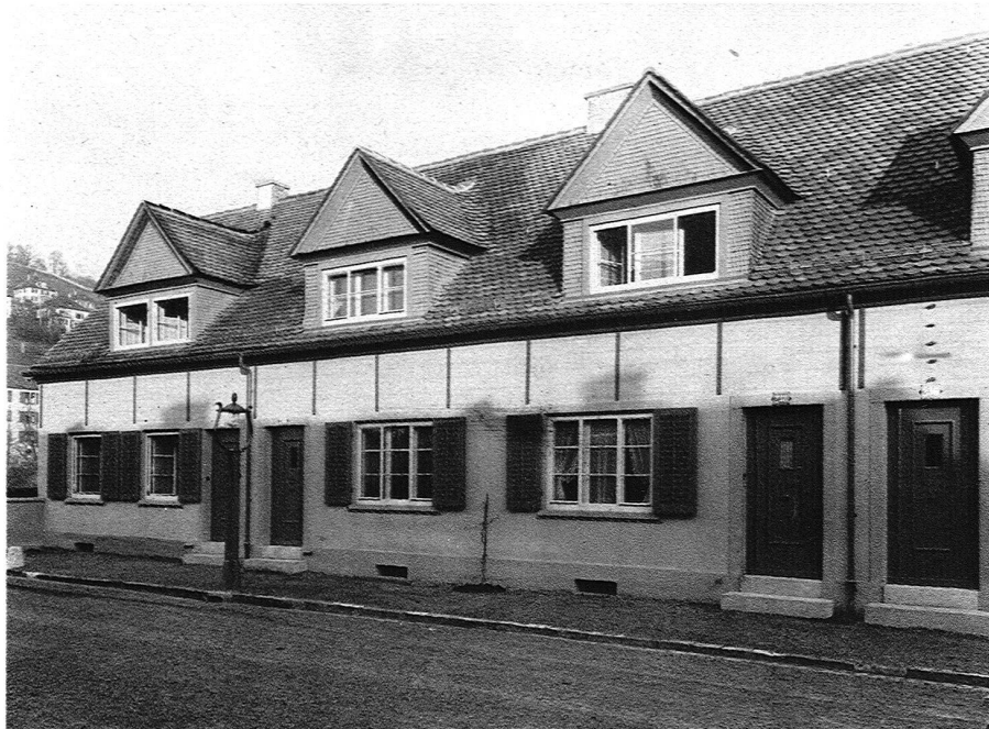
ABB. 7 WOHNKOLONIE AN DER HARDTURMSTRASSE, ZÜRICH DETAIL

5—8 Kopf hoch in Zweizimmerwohnungen haust. Ich habe es nicht gewagt. Aber ich habe wenigstens einen tastenden Schritt nach dieser Richtung gemacht: Ich habe den Keller verkleinert bis auf den Raum unter der kleinen Küche, dann habe ich das unterirdische Wesen wie zu Grossvaters Zeit durch Falladen und Leiter zugänglich gemacht. Ein Falladen in der Küche! Es war in Basel. Herrgott, gab das einen Tanz! Unter dem Titel einer ganz besonders ausnahmsweisen Begünstigung und gegen das heilige Versprechen, dass ich den gähnenden Abgrund (1,80 m tief!) mit einem Gitter oder «in sonst gutscheinender Weise» verwahren würde, wurde mir die Erlaubnis erteilt. Die Häuschen sind gebaut worden; als sie fertig waren, habe ich sie dem Publikum gezeigt, 4500 Personen haben das «kellerlose» Haus besehen, 4500 mal ist der Falladen geöffnet worden und 4500 Personen sind in das Kellerli hinuntergestiegen (nicht alle auf einmal, gottlob!) und alle haben mehr oder weniger schmeichelhafte Betrachtungen über diese Vorrichtung angestellt. Was mir wichtiger war: die von Behörden und Privaten so reichlich prophezeiten Unglücksfälle sind bisher ausgeblieben und die 12 Hausfrauen, die in den 12 Häuschen wohnen, sind alle mit ihrem Keller zufrieden.