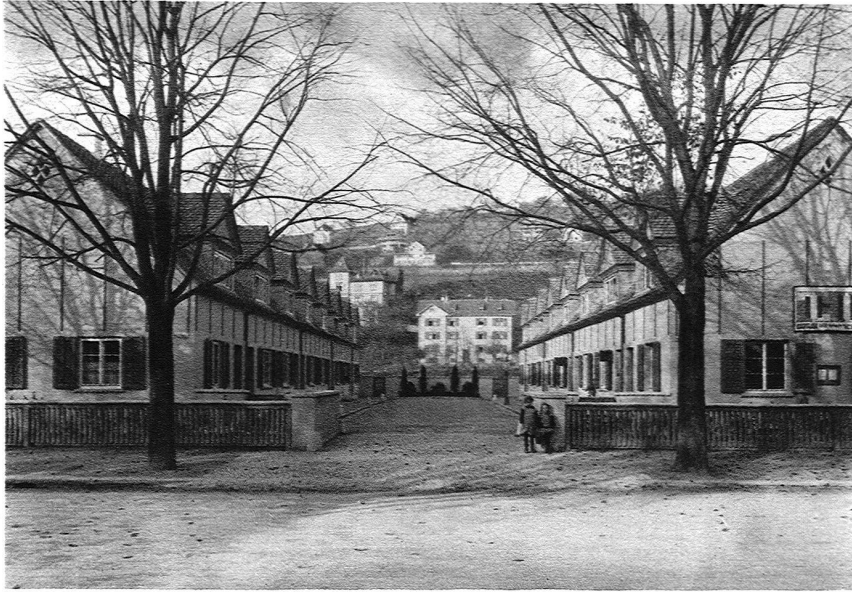
ABB. 6 WOHNKOLONIE AN DER HARDTURMSTRASSE, ZÜRICH BLICK IN DIE ERSTE GRUPPE (v. Abb. 5, linke Hälfte)

Menschengrösse gerichtet. Die Erfahrung der von Stephenson erfundenen Eisenbahnwagen belehrt uns, dass selbst für einen regen und aufgeregten Personenverkehr eine Türgrösse von 54 \times 198 cm genügt. Will man ein Uebrigtes tun, um auch für das gelegentliche Einbringen von Möbeln gerüstet zu sein, so geht man in England und Holland auf 76 und 78 cm. Mit meinen Basler Bauten bin ich auf 80 cm gegangen. In Zürich verfangen so primitive Ueberlegungen und so banale Erfahrungen nicht. In Zürich hält man an der Errungenschaft der französischen Revolution, am vierzigmillionsten Teil des Erdumfanges als Türnorm, fest. Es gibt Leute, die nur in einem Nord-Süd orientierten Bett schlafen, die am Freitag keine Reise antreten, die sich nur bei zunehmendem Mond die Haare schneiden lassen — warum sollte es nicht auch Behörden geben, die eine Haustürbreite von 1 Meter vorschreiben?