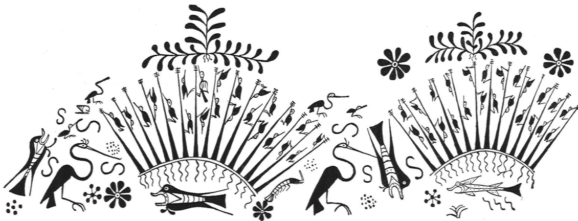
ZEICHNUNG AUF EINEM TONGEFÄSS AUS NORDPERU