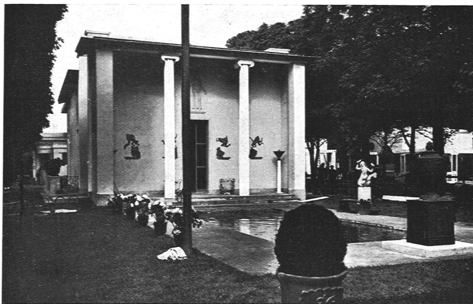
DER SCHWEDISCHE PAVILLON / ARCHITEKT CARL BERGSTEN