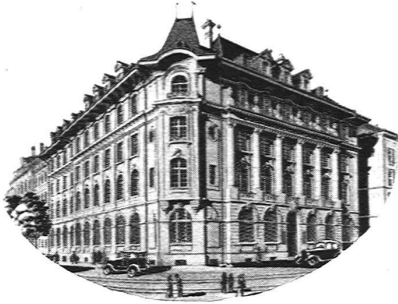
Sitz der Zentralverwaltung in Bern