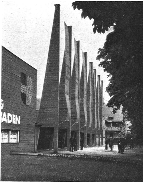
EINGANG AN DER PARKSTRASSE

Die Stadt Baden, in welcher gegenwärtig architektonische Aufgaben grössten Stiles in Angriff genommen werden (Hochbrücke über die Limmat, neues Schulhaus mit Sport- und Badeanlage), beherbergt seit 1. Juli auf einem schönen Gelände in unmittelbarer Nähe des bekannten Kursaals die Gewerbeausstellung des Kantons Aargau. Wenn wir hier zum erstenmal Gelegenheit nehmen, eine der vielen Gewerbeausstellungen, mit denen unser Land in den letzten Jahren gesegnet war, eingehender zu besprechen, so geschieht es vor allem mit Rücksicht auf die Architektur der Ausstellung , die schlechthin das Beste ist, was auf diesem Gebiete seit langem bei uns geleistet wurde. Man darf die Anlage des Architekten Albert Maurer B. S. A. (in Firma Vogelsanger & Maurer, Rüschiikon), dessen mit dem ersten Preis ausgezeichnetes Wettbewerbsprojekt ohne wesentliche Veränderungen ausgeführt werden konnte, in erster Linie damit charakterisieren, dass sie reine Ausstellungsarchitektur ist, dass sie in eindeutiger Art mit dem Hauptmaterial, dem Holze, rechnet, und dass sie schliesslich die dekorative Malerei sich in einer Weise dienstbar gemacht hat, die nicht genug zur Nachahmung empfohlen werden kann. Die Ausstellungshallen, in denen die Produkte des aargauischen Gewerbes vom Schmelzofen bis zum Batiktüchlein Platz finden mussten, gruppieren sich im wesentlichen um zwei