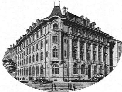
Sitz der Zentralverwaltung in Bern