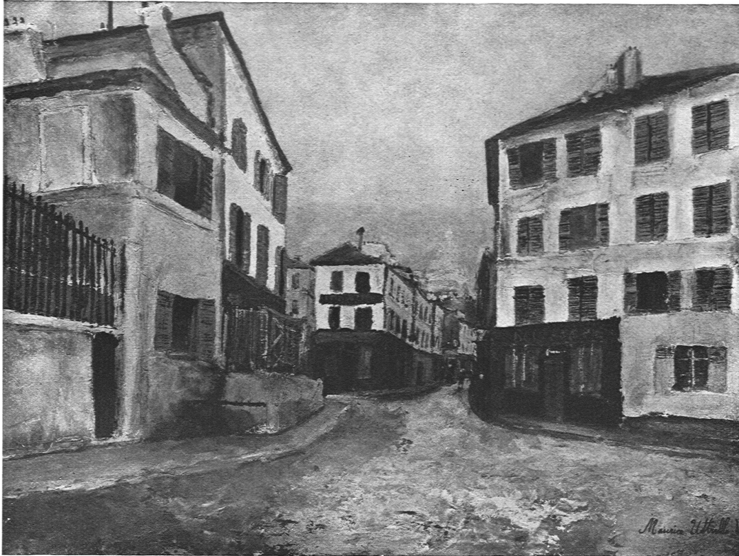
MAURICE UTRILLO, PARIS / PLACE DU TERTRE Aus der »Internationalen Kunstausstellung Zürich«