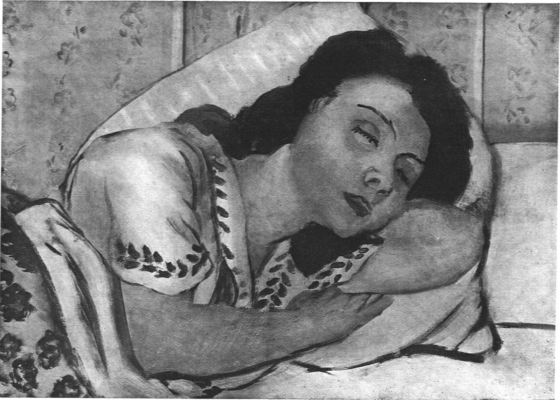
HENRY-MATISSE, PARIS / JEUNE FILLE DORMANT

Aus der »Internationalen Kunstausstellung in Zürich« (Cliché des Katalogs)