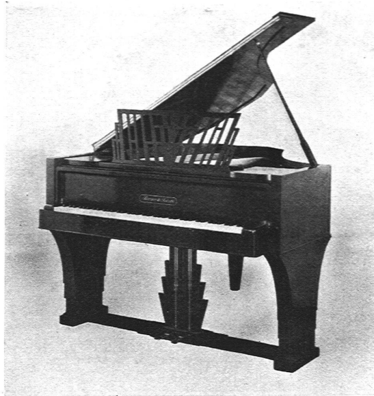
KLAVIER IN PALISANDER-MARQUETERIE AUSGEFÜHRT DURCH DIE PIANOFABRIK BURGER & JACOBI, BIEL, NACH ENTWURF VON ARCHITEKT BUFFAT, LAUSANNE

»Zum Schlusse möchten wir noch darauf hinweisen, dass in dem offiziellen Generalkatalog der Pariser Ausstellung der »Section Suisse« ganze zwei Seiten gewidmet sind. Auf diesen beiden Seiten werden aber nicht etwa die Aussteller oder die Produkte, welche man in unseren vier Ausstellungsabteilungen sehen kann, aufgeführt, sondern nur die Namen der Kommission, der Jury und des Kommissariates. Andere Länder, mit deren Vertretung die Schweiz gewiss konkurrieren darf, haben es fertiggebracht, die Aussteller und die ausgestellten Artikel schön geordnet aufzuführen. Warum war das für die Schweiz nicht möglich? Angeblich weil zwei Industriegruppen ihre Listen nicht rechtzeitig eingesandt haben. Warum hat man denn nicht wenigstens diejenigen im Katalog aufgeführt, die ihre Anmeldung und ihre Listen rechtzeitig dem Kommissariat zugestellt haben? Warum hat man nicht wenigstens die grossen Gruppen der Aussteller der Schweizervertretung aufgeführt, welche doch schon ein halbes Jahr vorher genau bekannt waren? Das sind alles Organisationsfragen, welche entschieden vernachlässigt wurden und für welche nicht die Industriellen im grossen ganzen verantwortlich gemacht werden können.«