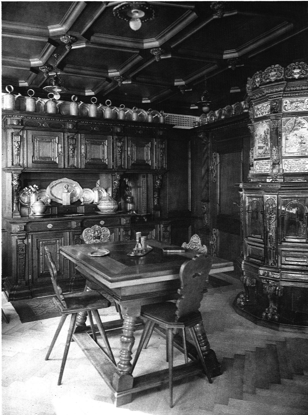
STUBE IN RENAISSANCE-STIL IN ZUG J. KELLER & CIE., MÖBELFABRIK, ZÜRICH