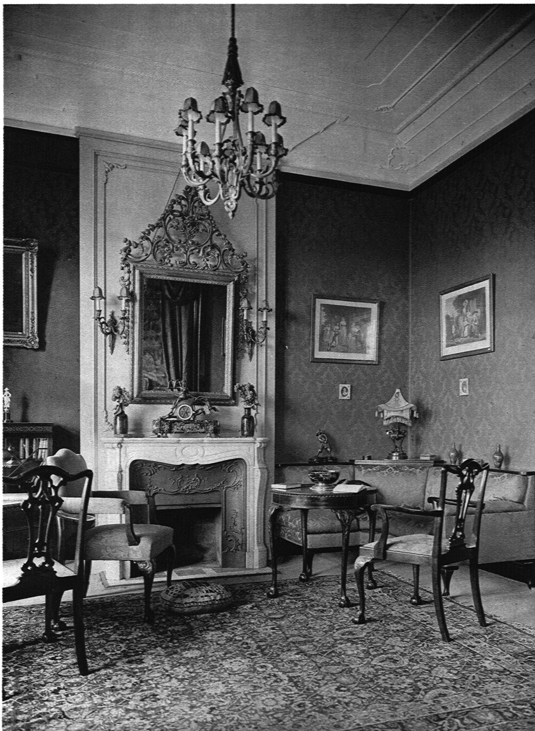
SALON IN EINER VILLA IN ZÜRICH J. KELLER & CIE., MÖBELFABRIK, ZÜRICH