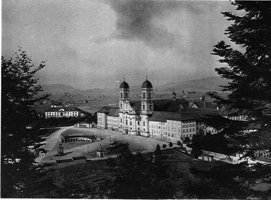
KLOSTER EINSIEDELN / GESAMTANSICHT VON SÜDWESTEN

Birchlers Stärke liegt ohne Zweifel in der Analyse. Er zerlegt etwa in dem ersten Kapitel die ganze Anlage wie mit dem Seziermesser, er verfolgt das einmal festgestellte architektonische Motiv bis in seine Verästelungen, und wer diesen Text fortwährend an den zahlreichen Bildtafeln des Anhangs und an den sauber gezeichneten Plänen kontrolliert, erhält eine sehr genaue Vorstellung von dem Werke des Caspar Mosbrugger. Ausgezeichnet, wie Birchler etwa den Gegensatz zwischen der flächigen Klosterfassade und der auf Tiefenwirkung angelegten Kirchenfront schildert, wie er die »Vorarlberger Bauformen« (Längstonne im Hauptschiff, Quertonnen zwischen den eingezogenen Streben der Seitenschiffe) charakterisiert, wie er die komplizierten Wölbungsverhältnisse im Oktogon klarlegt — hier hätten ein paar Achsenschnitte gute Wirkung getan — und wie er schliesslich im letzten Kapitel von den Plänen Mosbruggers für Einsiedeln aus die übrigen zum Teil fraglichen