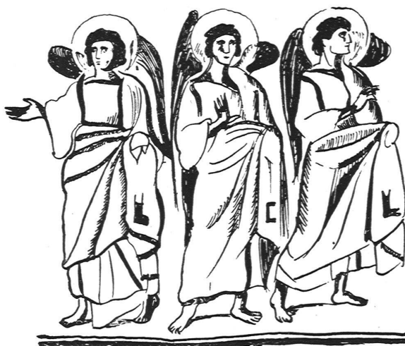
ENGEL DER VERKÜNDIGUNG, AUS DEM TRIUMPHBOGENMOSAIK VON SANTA MARIA MAGGIORE IN ROM

und Technik begleitet, ferner einen Stich nach einem Aquarell des Portugiesen Francisco de Hollanda, der in der Zeit seines römischen Aufenthaltes in den 40er Jahren des Cinquecento die damals noch vollzählig erhaltenen Mosaiken von Santa Costanza kopiert hat. Mit diesen ältesten Dokumenten der christlichen Mosaikkunst beginnt der zweite Teil des Buches; hier steht zu Anfang jedes Kapitels eine Aussenansicht der Kirche, von deren Mosaiken gehandelt werden soll, dann folgen kurze historische Notizen über die Kirche und ihre musivische Aus-