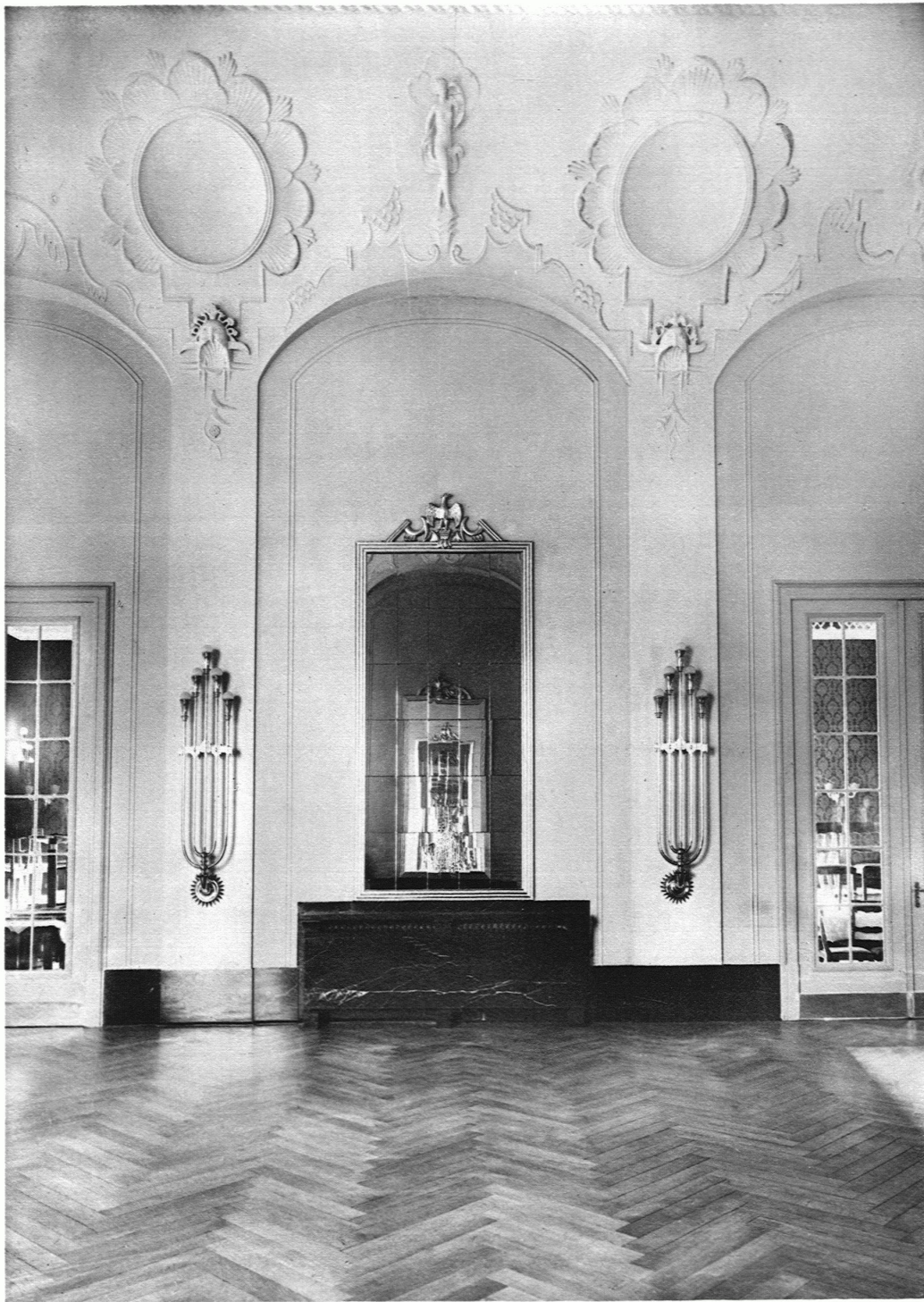
DER FESTSAAL IM KURSAAL HENNEBERG / DETAIL