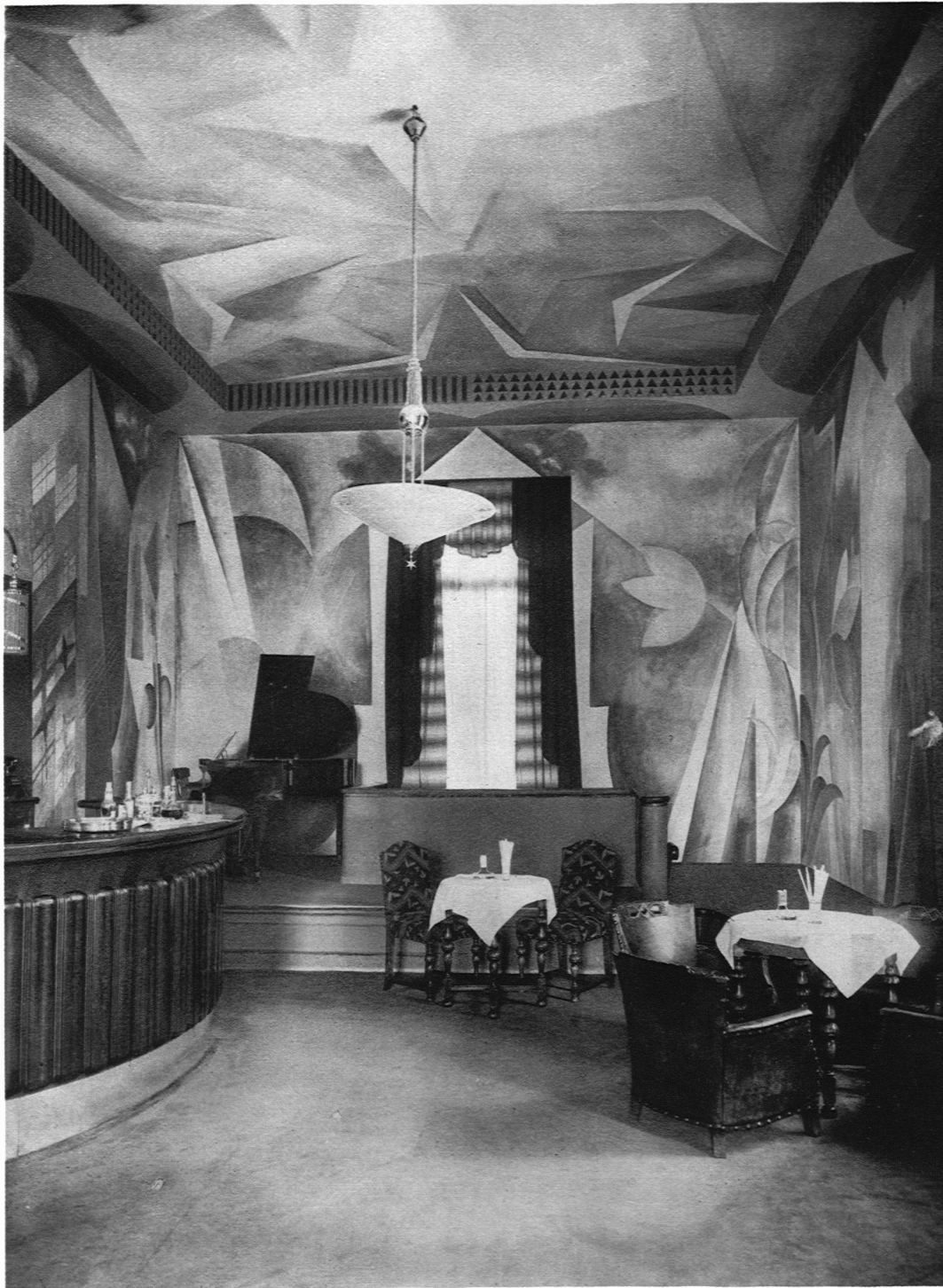
BAR IM KURSAAL HENNEBERG ZÜRICH