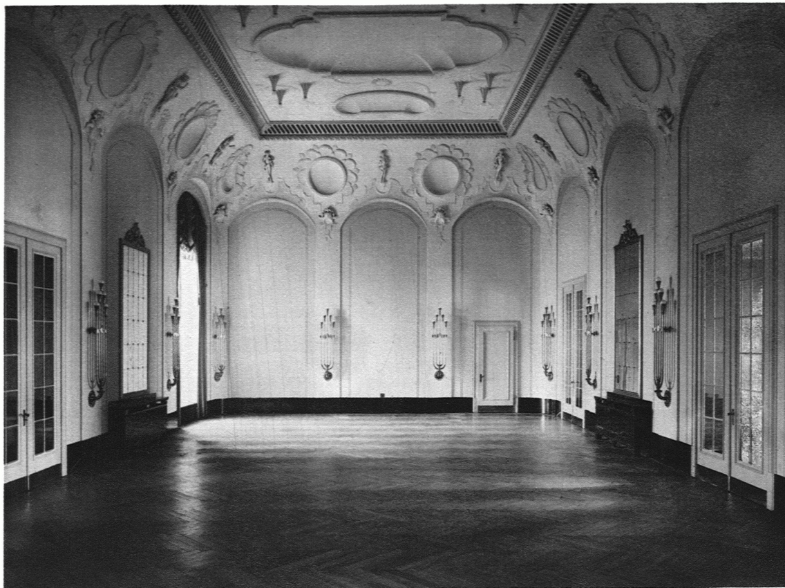
DER FESTSAAL IM KURSAAL HENNEBERG

Architekten: Henauer & Witschi B. S. A., / Dekorative Plastik: Otto Münch S. W. B., Zürich