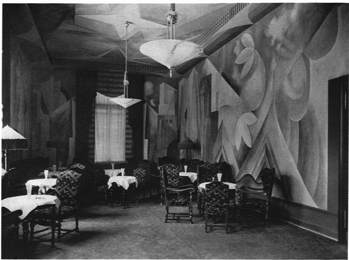
HENAUER & WITSCHI, ARCHITEKTEN B. S. A., ZÜRICH / BAR IM KURSAAL HENNEBERG Malerei von E. Staub, Thalwil

Non sans raison, Le Corbusier fait le procès des appartements tels qu'ils sont aujourd'hui, c'est-à-dire inhabitables. La vraie formule — pour lui du moins — est l'immeuble-villa dont les plans furent également exposés en 1922.