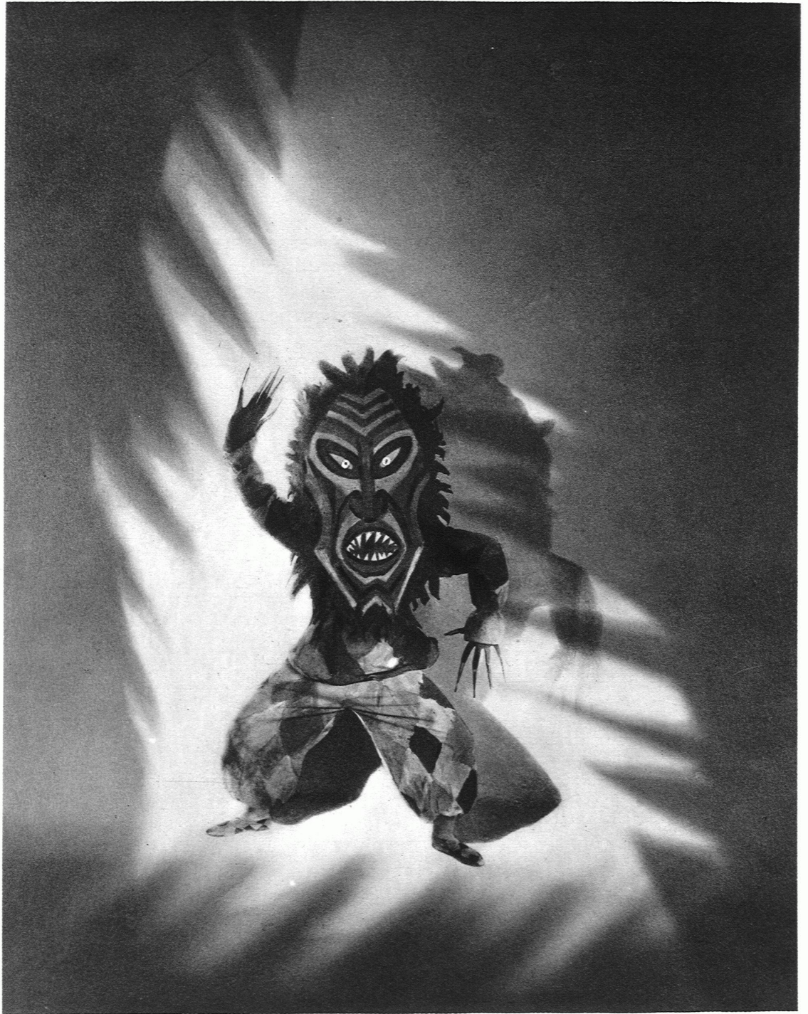
EMMY SAUERBECK / GROTESKE