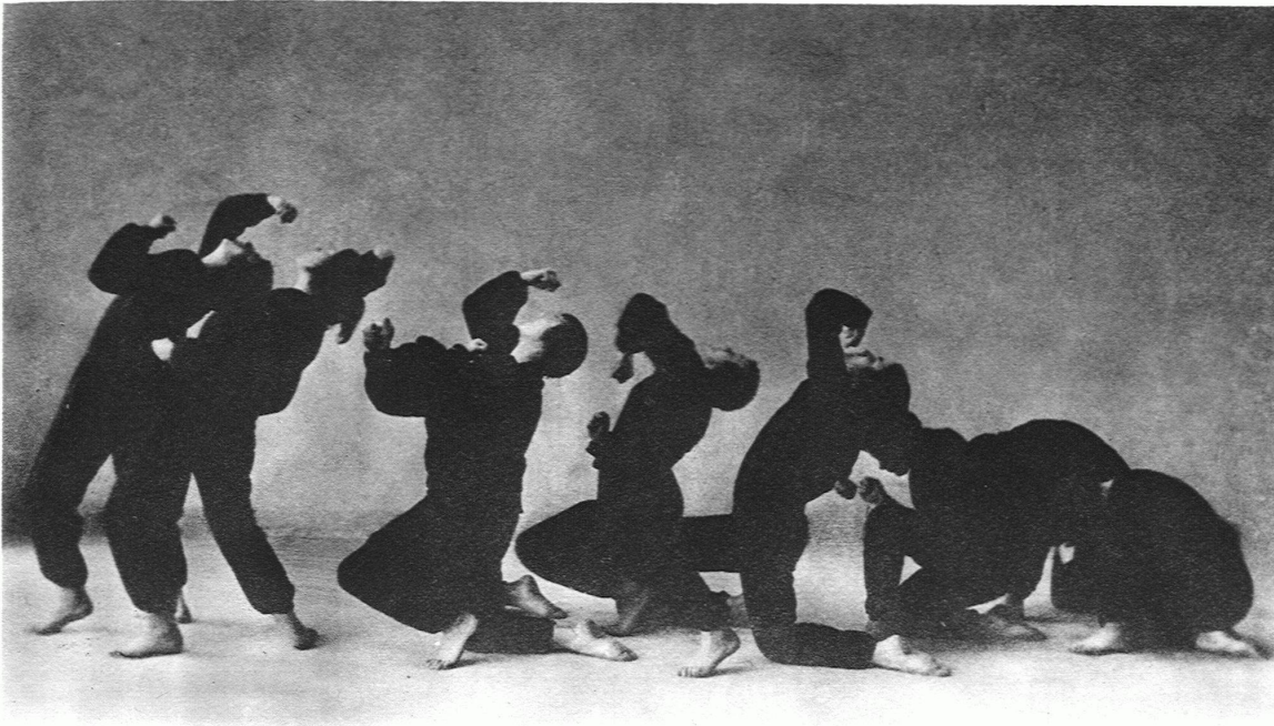
EMMY SAUERBECK / KLAGENDE

Gewissheit eines Währens ohne Ende. Der »Sonnen- gesang«: Anbetung, Entrückung, Auflösung im Licht. Langsames Schreiten darauf zu, Eintauchen in eine alles überströmende, alles reinigende Flut von Licht.