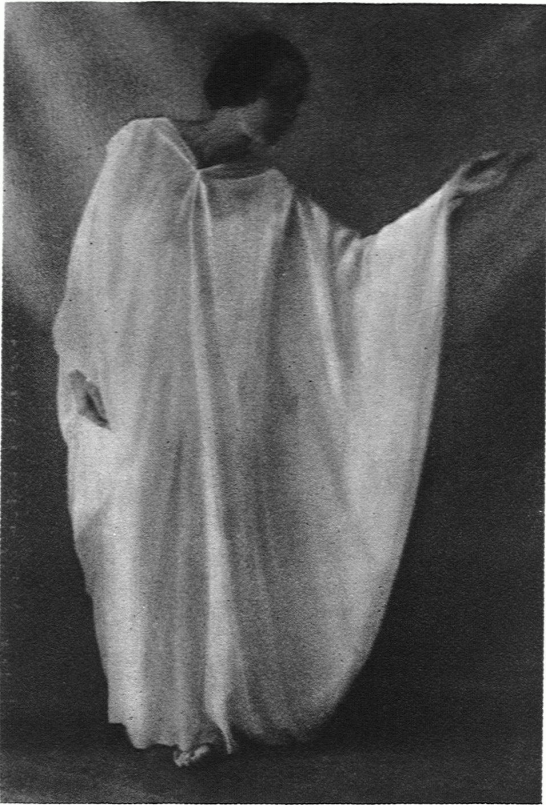
DREISTIMMIG / TEILANSICHT