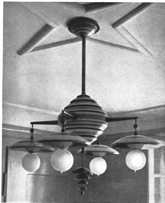
Esszimmerleuchter: blau, weiss und gelb gestrichen: Stiel, Arme und Gehänge in Messing

HANS MÄHLY, ARCHITEKT, BASEL / HAUS ZUM SCHNEGG IN MEGGEN