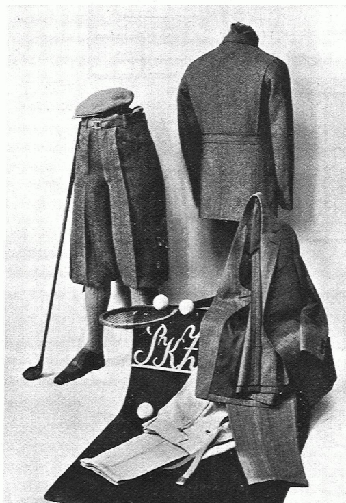
BURGER-KEHL & CO., ZÜRICH PKZ-Schau fenster