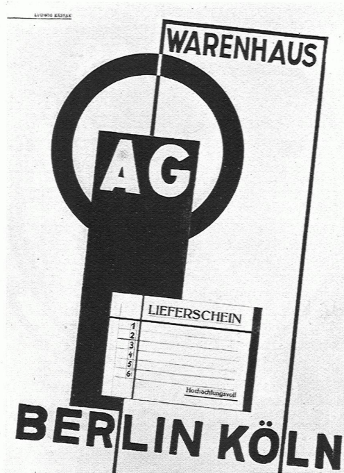
LAJOS KASSAK Warenprospekt 1926

Stimmungsnuancen und illustrative Redseligkeit widersprechen dem Wesen der Reklame, bringen es um die Promptheit der Wirkung und um die überzeugende Suggestion. Die gute Reklame ist nicht analytisch und definierend, ist synthetisch — Einheit von Zeit, Inhalt und Stoff. Diese ihre elementare Einfachheit und Reinheit lässt uns im Strassengewühl stillstehen und in ein Warenhaus treten, das uns vor einer Minute nicht einmal vom Hörensagen bekannt war, diese gibt