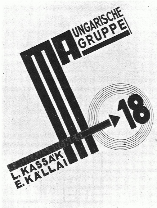
LAJOS KASSAK, WIEN Buchtitel, 1926