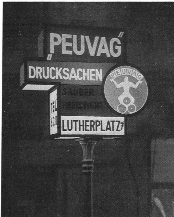
WALTER DEXEL, JENA Reklame-Laternen

uns das Buch eines niegenannten Autors in die Hand, weckt uns aus der Blindheit und Taubheit des Alltags, macht uns durch ihre elementaren Farben und dynamischen Formgliederungen neugierig und entschlossen.