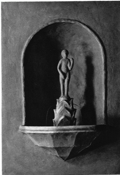
WALTER GYGI Entwurf zu einem Brunnen