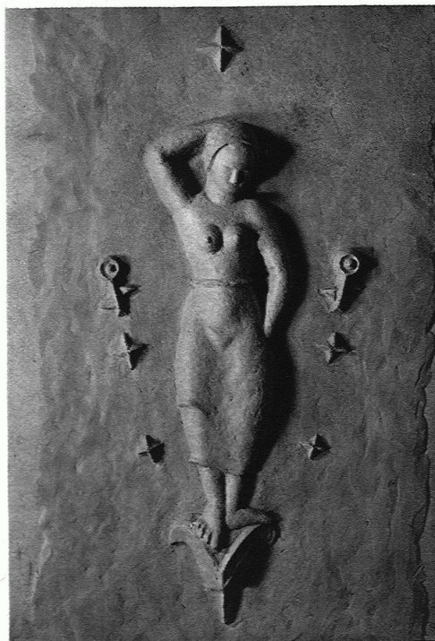
WALTER GYGI Dekorative Figur