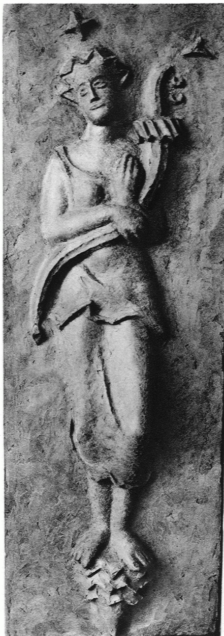
WALTER GYGI Fassadenfigur

Die Gegner, dieses wie es scheint von den Behörden bereits genehmigten Planes, berufen sich darauf, dass die Umgebung der Strasse Am Hof inzwischen so hässlich überbaut worden sei, dass eine neue Barockfassade hier doppelt deplaziert wirken müsse. Die Frage ist deshalb von allgemeinerem Interesse, weil auch bei uns immer wieder das Problem der Ergänzung oder des Ausbaues historisch wertvoller Architekturen auftaucht, sei es, dass es sich um ein einzelnes Gebäude handelt oder um alte einheitliche Strassenzüge, in denen eine Lücke zu füllen ist. Der letztere Fall tritt ganz besonders häufig in Bern auf, wo man sich in der Regel mit einer im Detail etwas gemilderten Barockfassade behilft (neuestes Beispiel: das Karl Schenk-Haus). So sehr solche Lösungen auf den ersten Blick befriedigend scheinen — weil die Einheitlichkeit der hier ganz besonders imposanten Strassenwand erhalten bleibt — so müssen sie doch mit der Zeit zu dem eigenartigen Resultate führen, dass das 20. Jahrhundert, aus